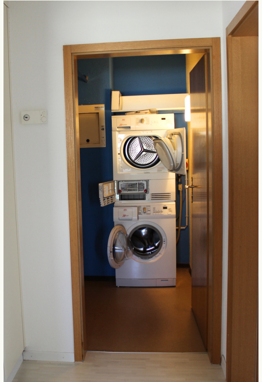
Eigener Waschturm mit neuer Waschmaschine (2024) und Tumbler.