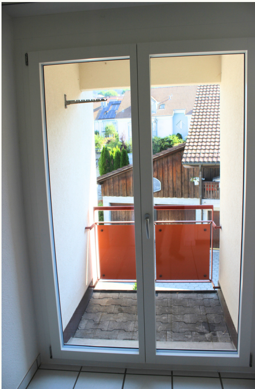
Kleiner Balkon auf Seite Hauseingang.