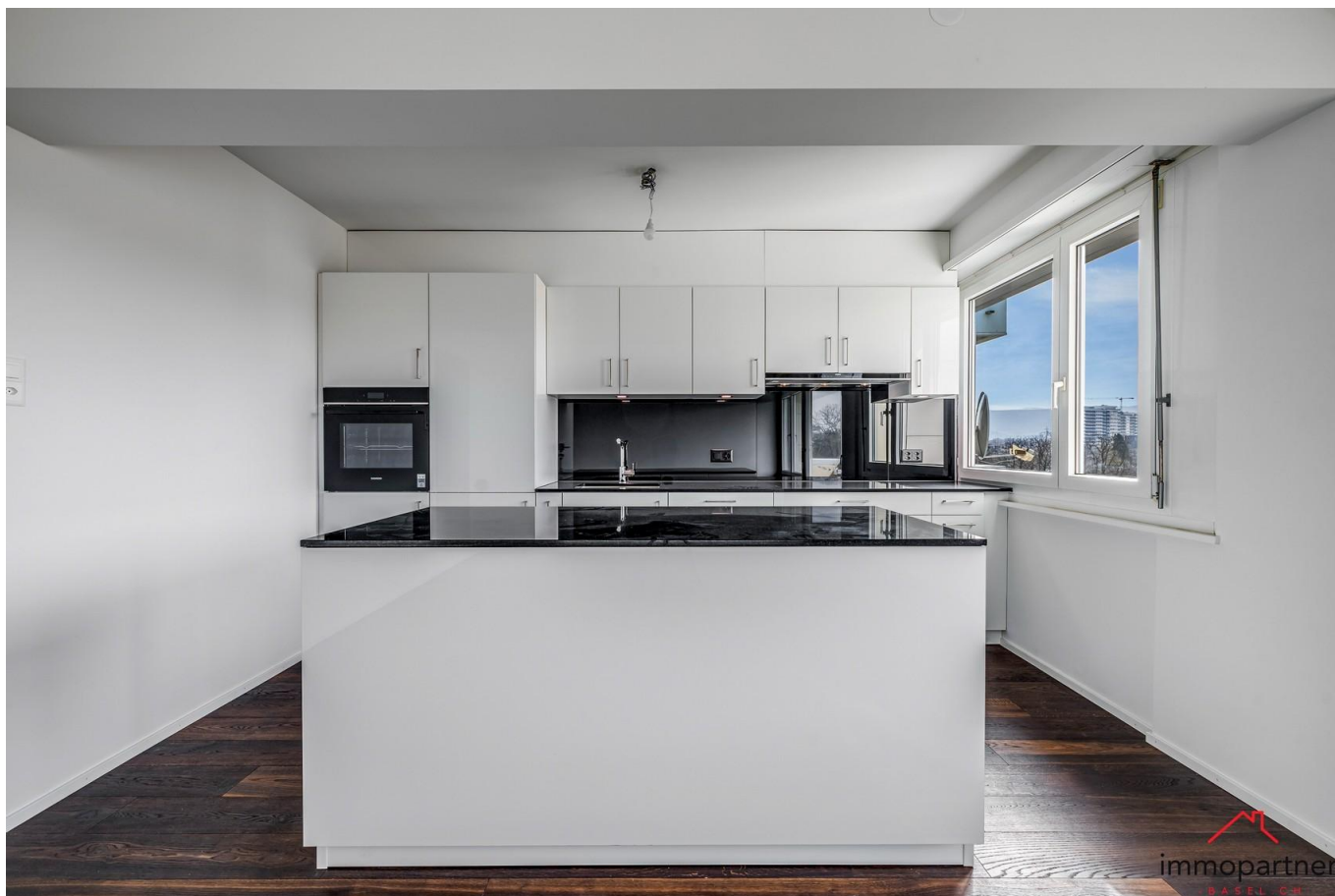
Einladender Wohnbereich - top modern