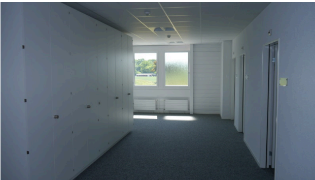
Vorraum mit Aktenschränken