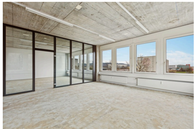
Offener Bürobereich / Sitzungszimmer