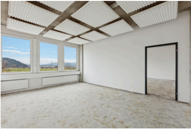
Sitzungszimmer mit Akustikdecke