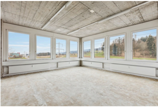
Halboffenes Eckbüro mit Blick ins Grüne