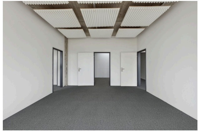
Sitzungszimmer mit Akustikdecke (Visualisierung Teppichboden)