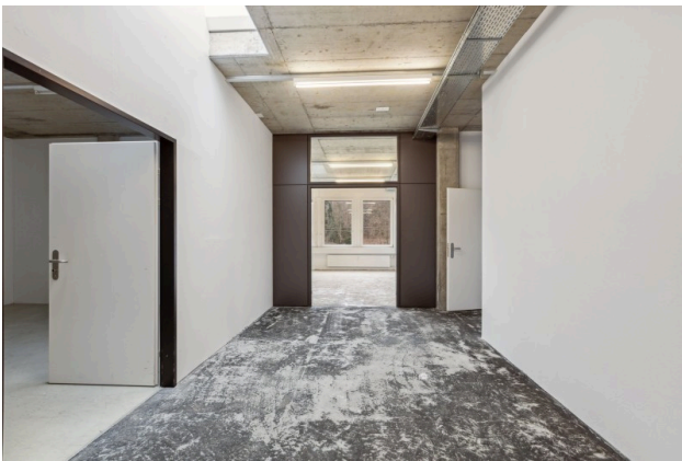
Eingang / Korridor