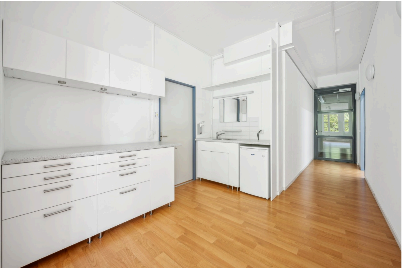
Bistrobereich, Korridor, Eingang