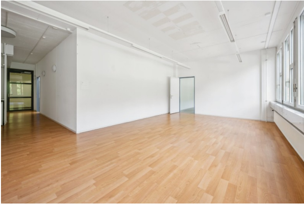
Büro 2 / Sitzungszimmer