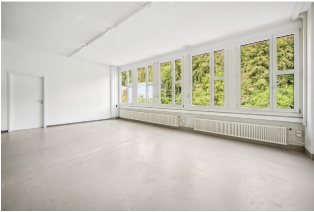
Gewerbereich mit Hartbetonboden (grau gestrichen)