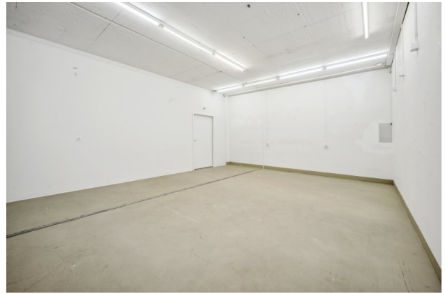
Gewerberaum / Archiv