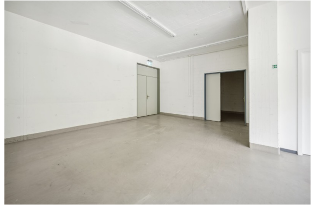
Gewerbereich mit Zugang zum Warenlift