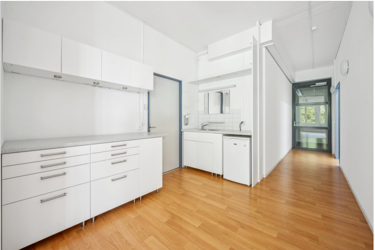
Bistrobereich, Korridor, Eingang