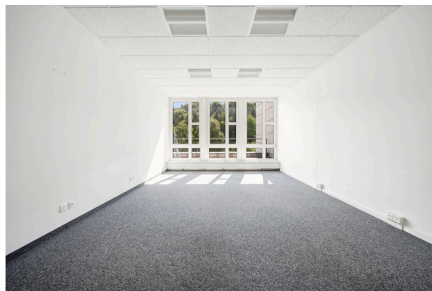
Büro 1 / Sitzungszimmer