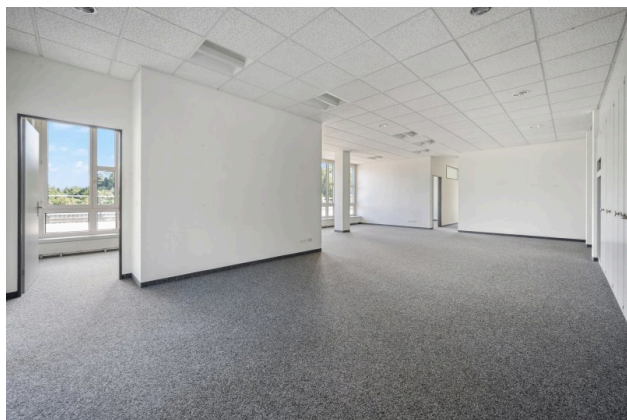
Eingang / Empfangsbereich