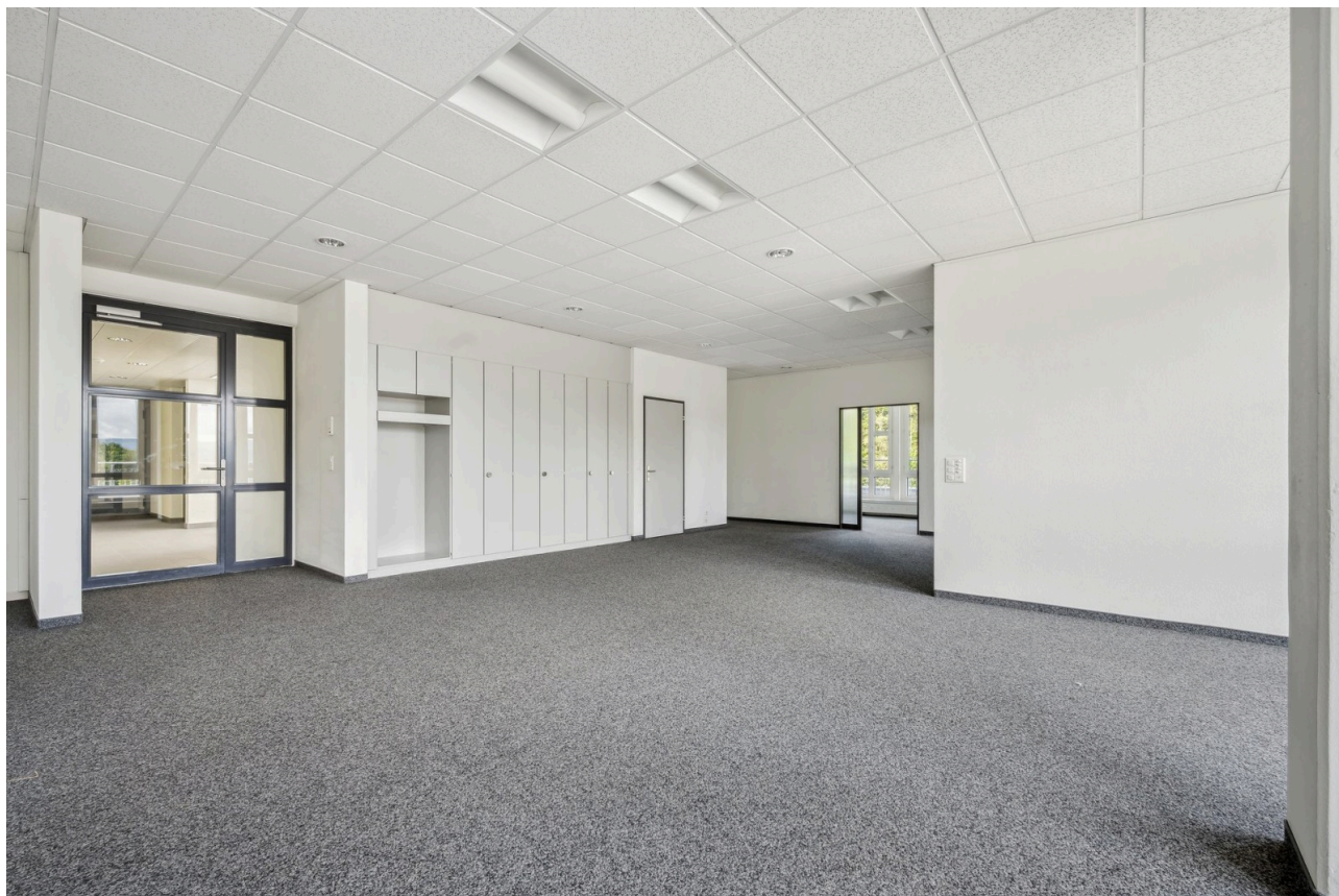
Eingang Bürofläche mit Einbauschränken