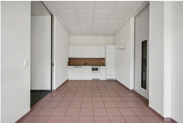
Küche / Aufenthalt