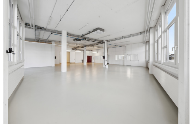
Lager / Produktion