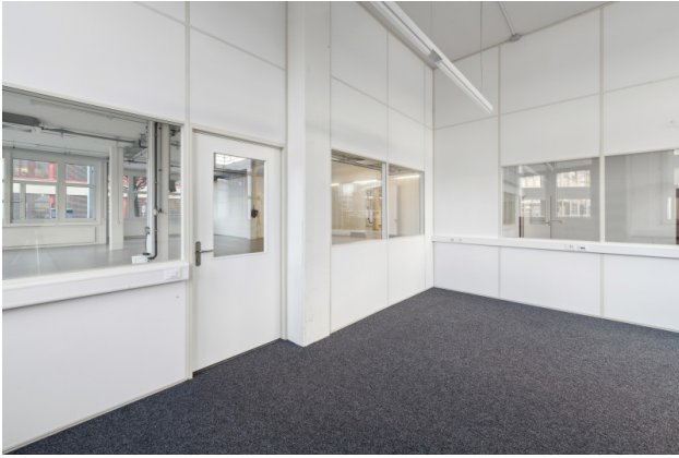
Büro mit Zugang Lager / Produktion