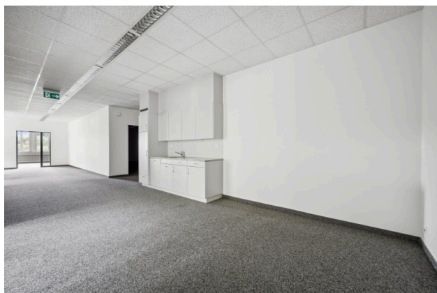
Küche / Aufenthalt