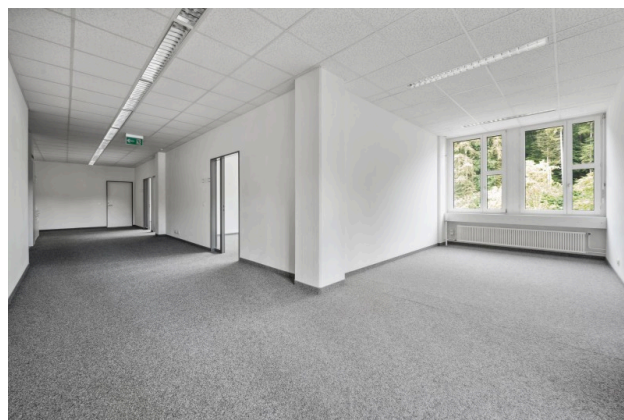
Korridor / offener Bürobereich