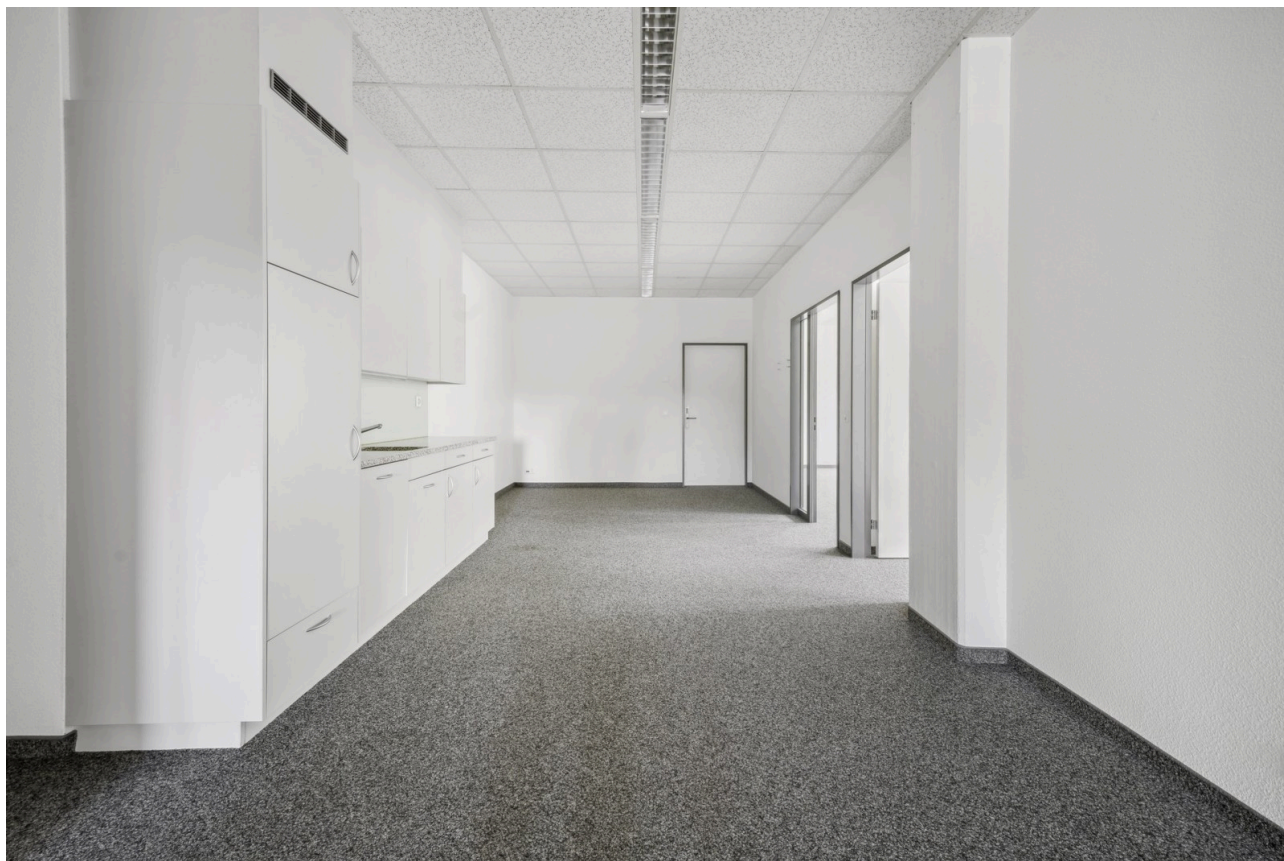
Küche / Aufenthalt