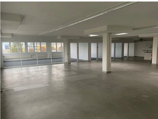
Ansicht Bürofläche mit Glaswänden