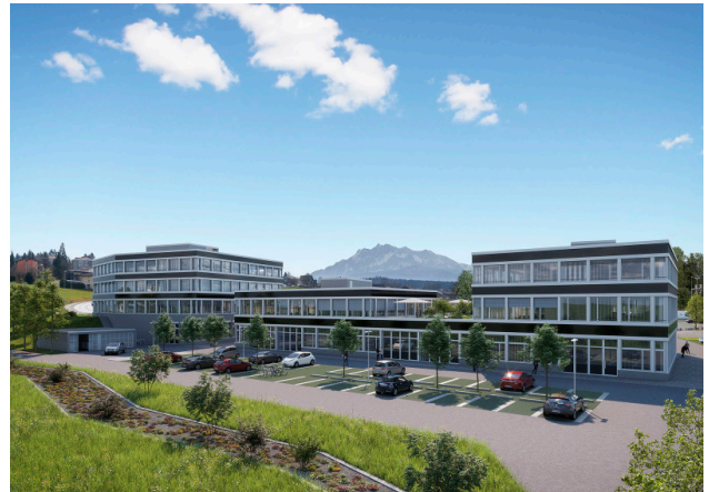
Rückseite der Gebäude 1, 3, 5 (von links)