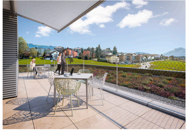
Dachterrasse mit besten Aussichten zur Mitbenützung (Gebäude 1)