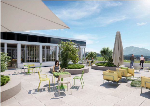
Exklusive, begrünte Terrasse 1. Obergeschoss (Gebäude 3/5)