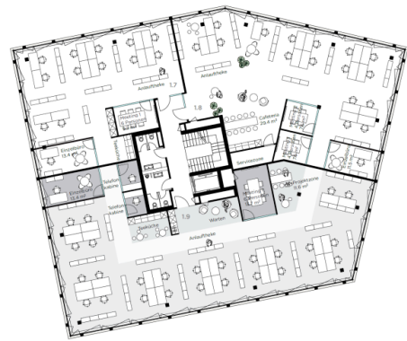
Layoutvorschlag 3. OG