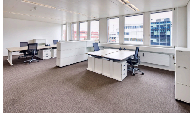
Teamoffice mit 6 bis 8 Arbeitsplätzen