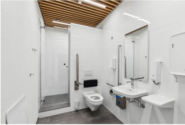
Sportlerdusche zur Mitbenutzung