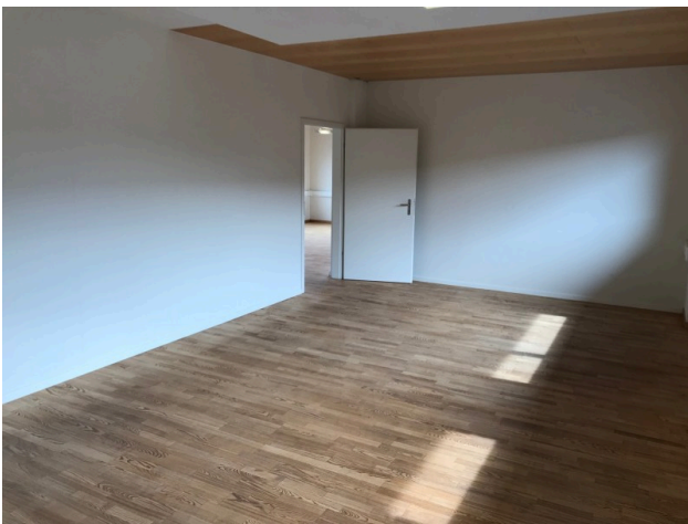
Büro / Sitzungszimmer