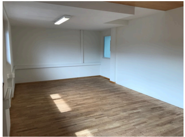
Büro / Sitzungszimmer