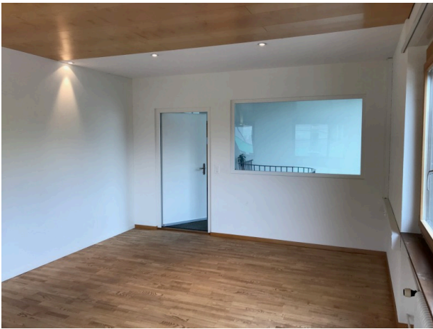
Büro / Sitzungszimmer