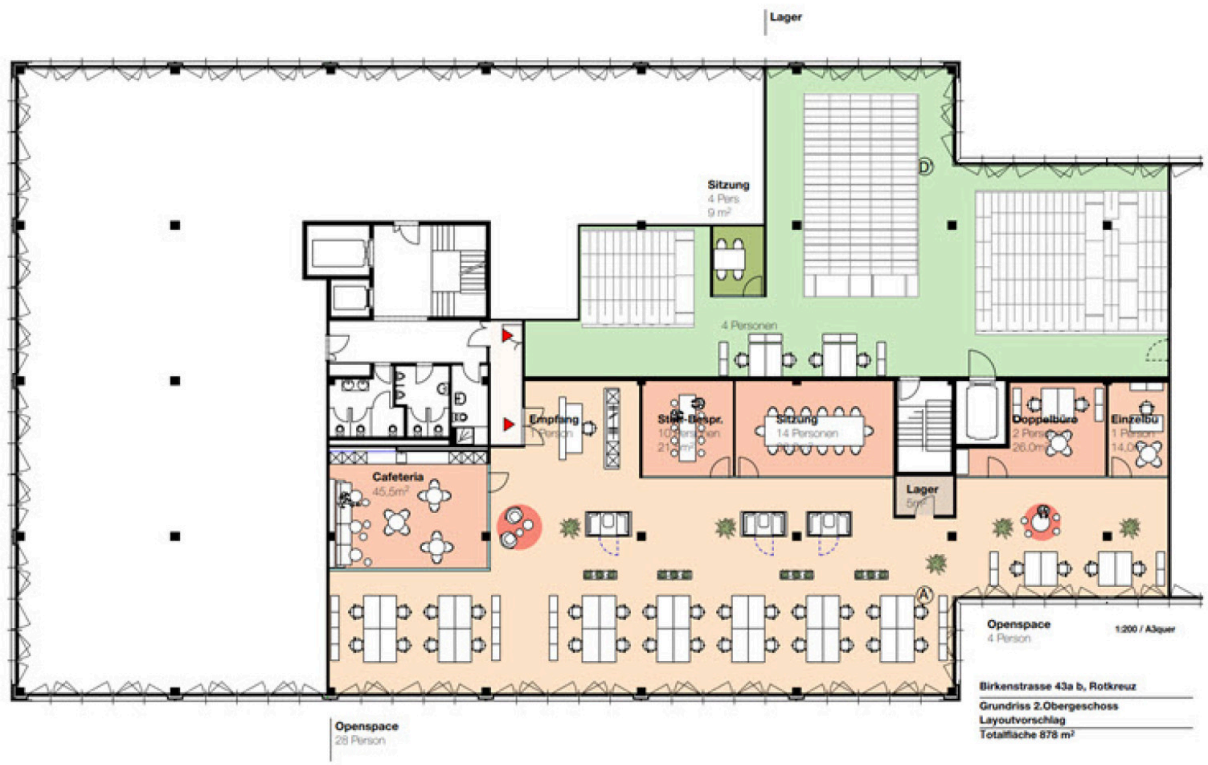
Grundrissplan 2. Obergeschoss Birkenstrasse 43a/b, 6343 Rotkreuz