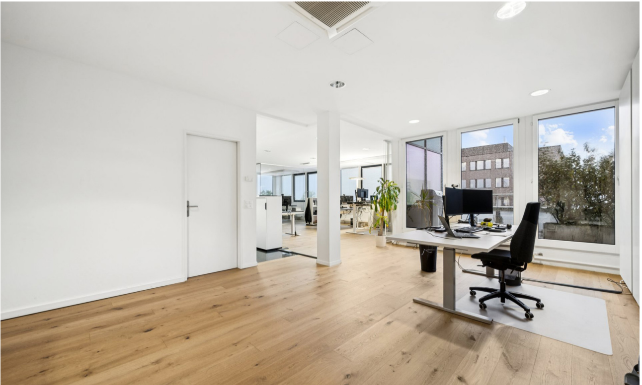
Lichtdurchflutete Büros mit Parkettboden