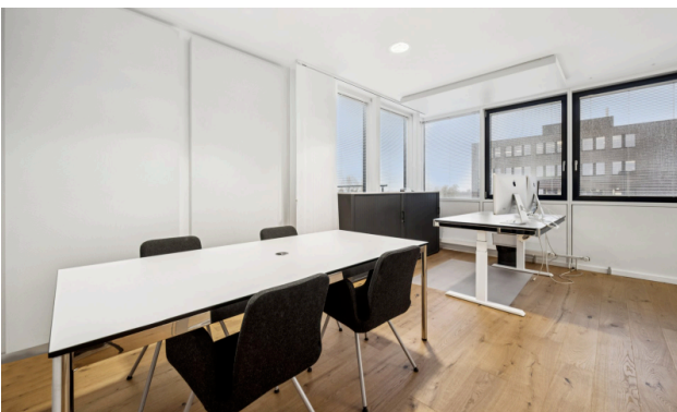
Einzelbüro mit Platz für Besprechungstisch