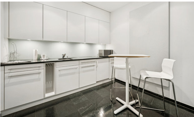
Teeküche mit Kühlschrank