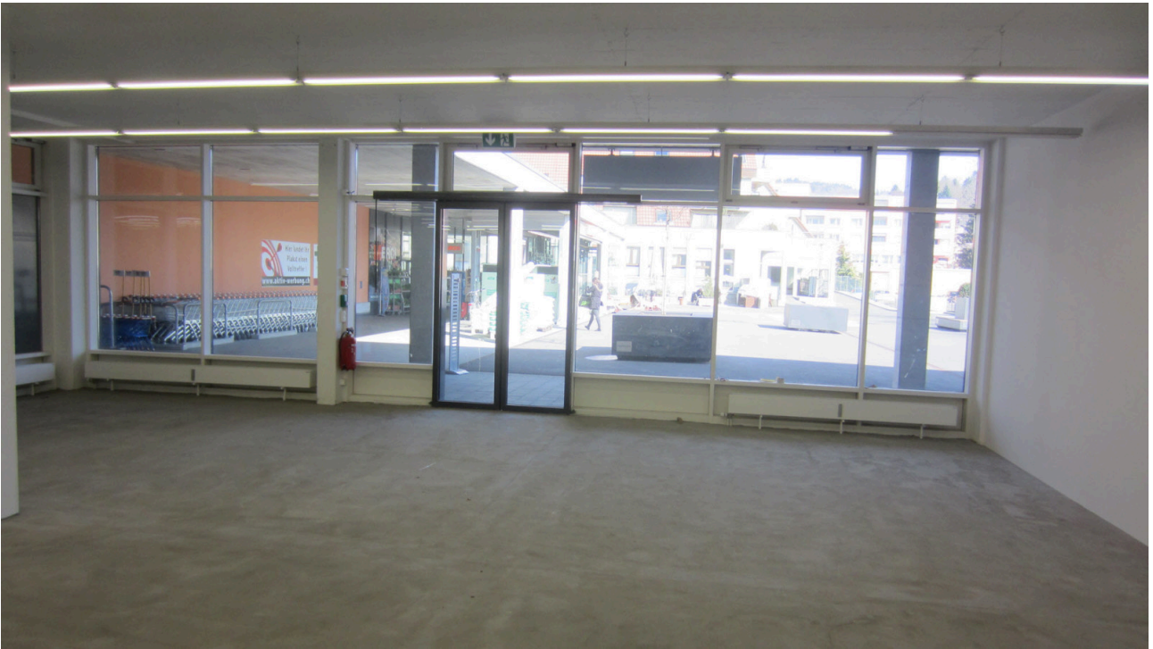
Front Aussicht 1