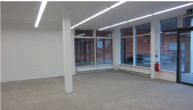
Front Aussicht 2