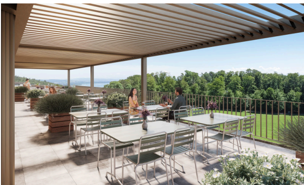
Vue sur le lac et bain de soleil – la terrasse parfaite pour savourer un déjeuner paisible