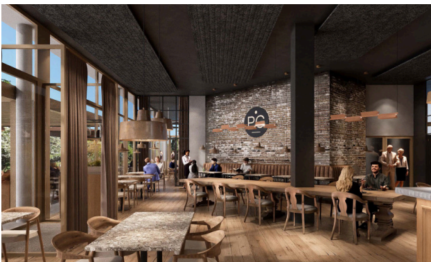
Restaurant au rez-de-chaussée – élégance à l'intérieur, charme sur la terrasse extérieure