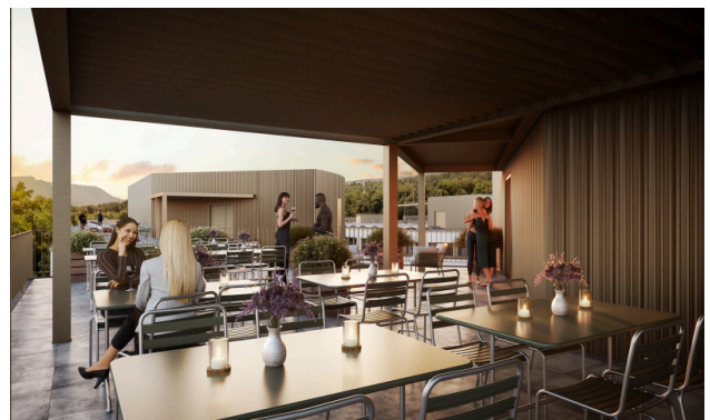
Moments après le travail – l'apéritif parfait au-dessus des toits de la ville