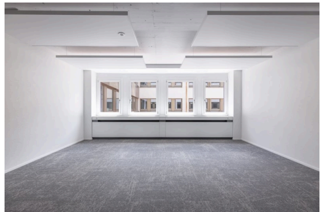
Musterbeispiel Office (35 m 2 ) - Ihre leere Leinwand für neue Ideen