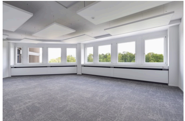
Musterbeispiel Office (81 m 2 ) – unmöbliert, bereit für Ihre Vision