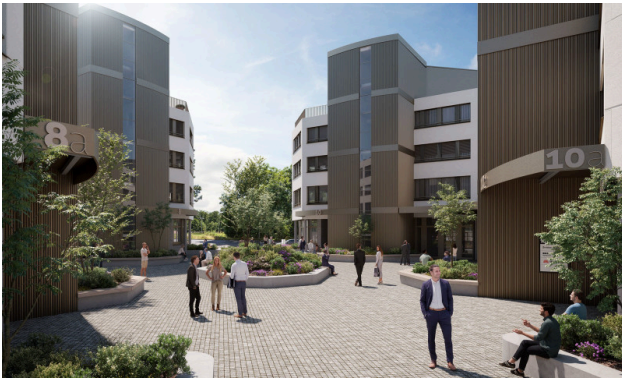
Cour intérieure végétalisée - un havre de calme et de bien-être