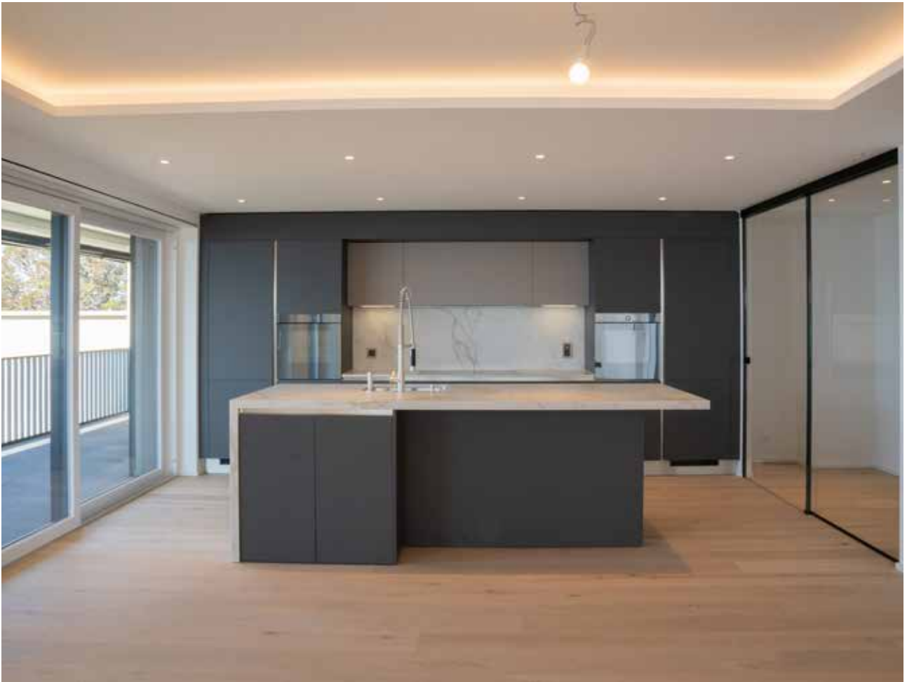
6 - Terrasses De Lavaux - Attique