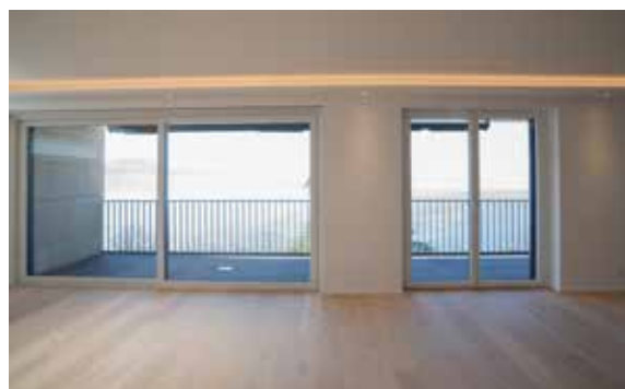
8 - Terrasses De Lavaux - Attique