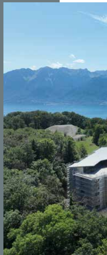
4 - Terrasses De Lavaux - Attique