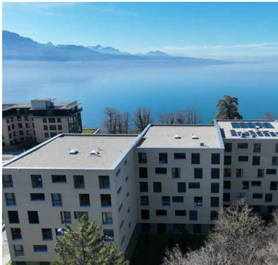
2 - Terrasses De Lavaux - Attique