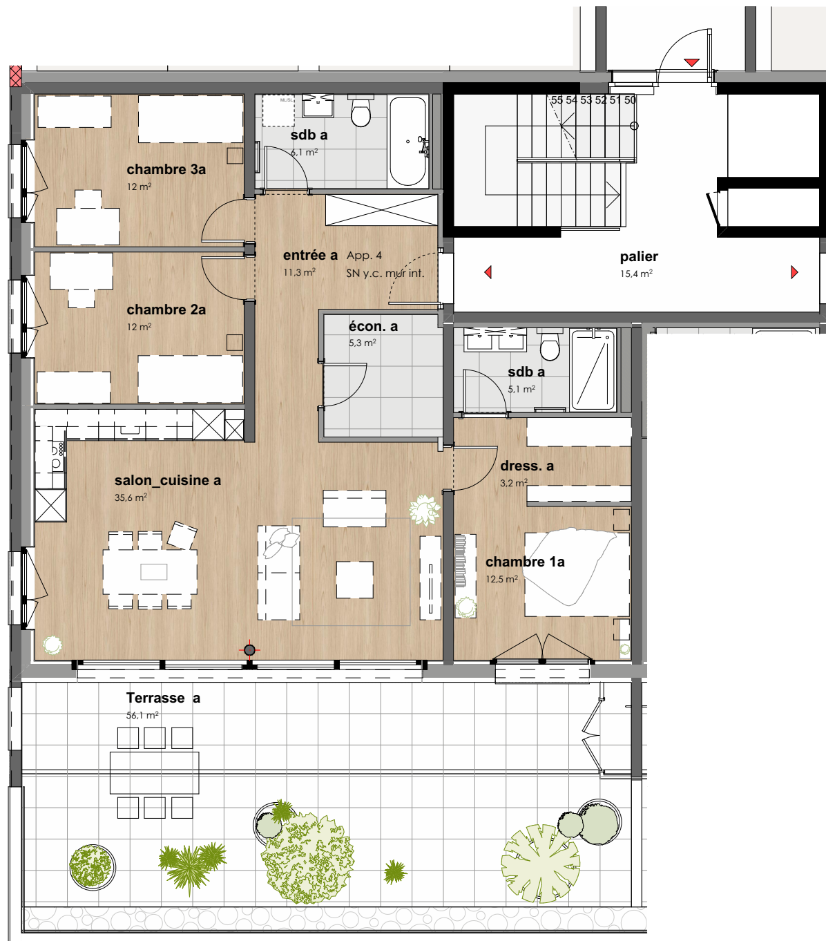
Rez-de-chaussée - app. n°4