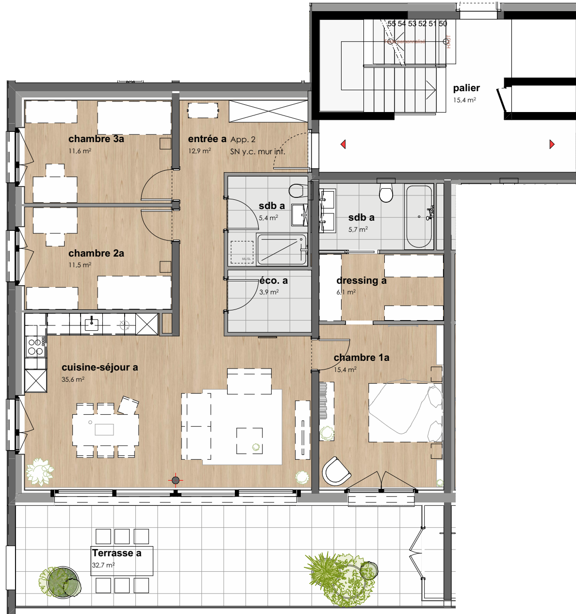
Rez inférieur - app. n°2