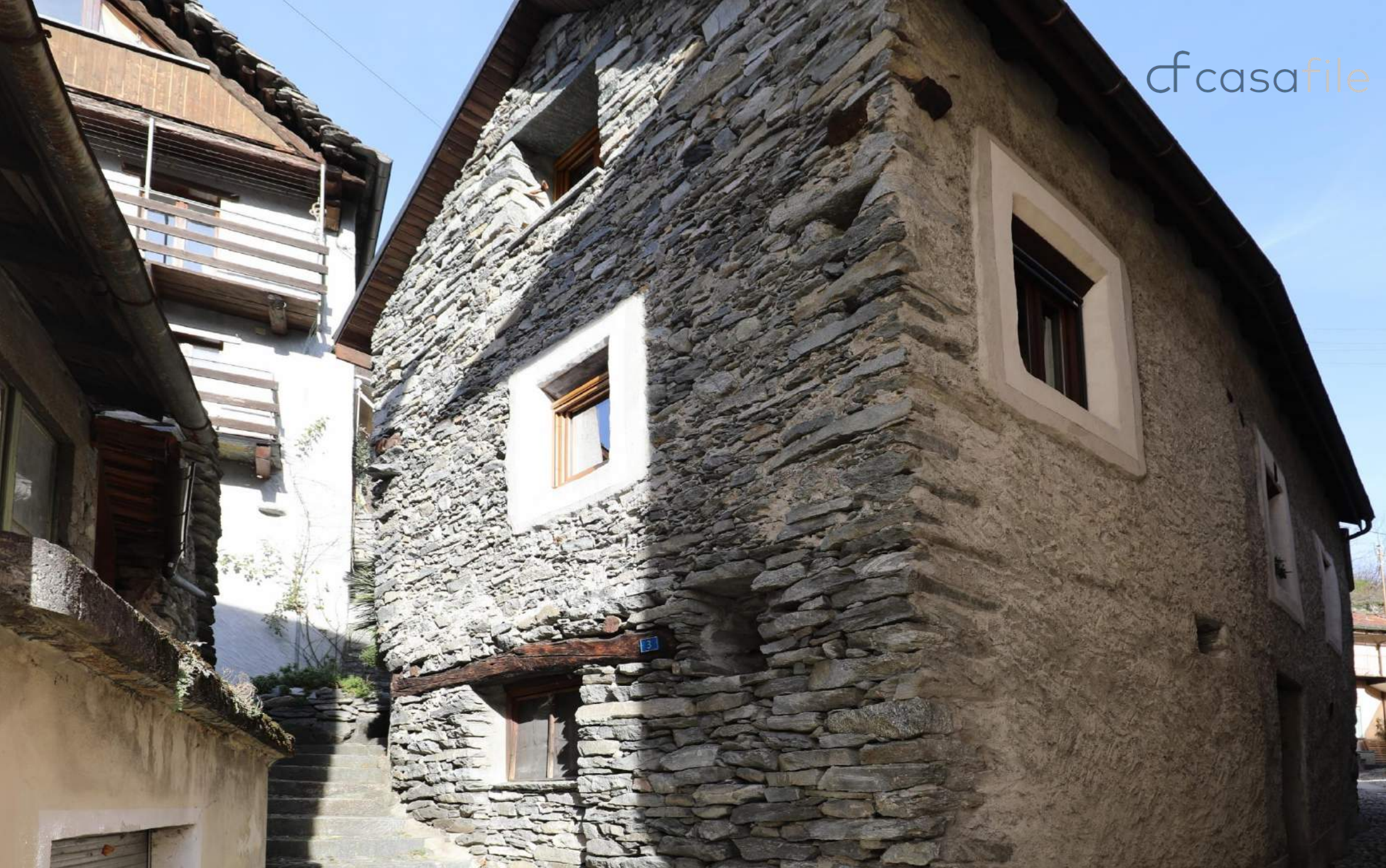
Schönes und grosszügiges Rustico im Nucleo gelegen Via Bronn d'Mezz 3, 6690 Caveragno-Cevio