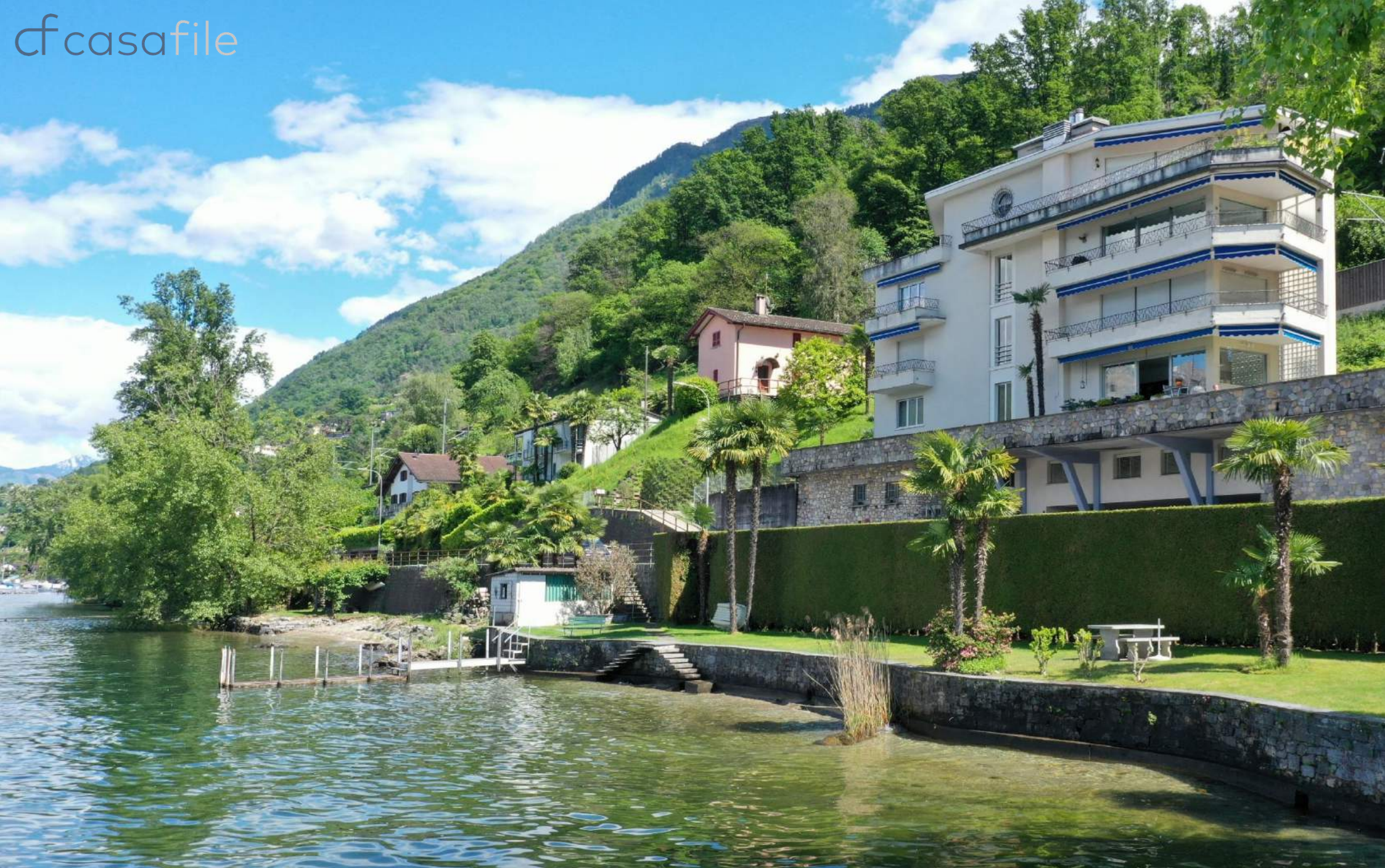
Eigentumswohnung mit unverbaubarer Seesicht und direktem Zugang zum Lago Maggiore Via Vignascia 19, 6579 Piazzogna Gambarogno