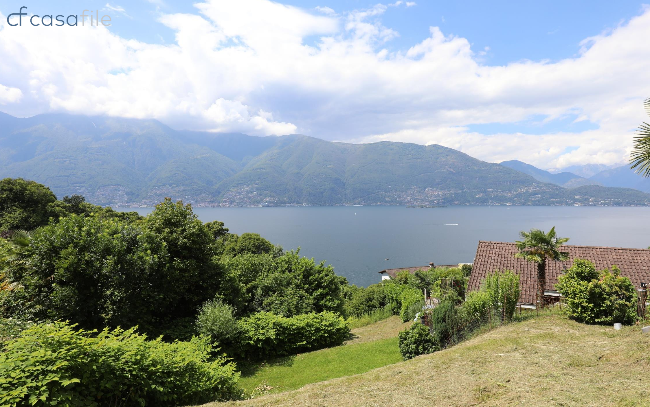
Baugrundstück mit herrlicher Sicht auf den Lago Maggiore an Hanglage in Caviano Via Campien, 6578 Caviano Gamberogno