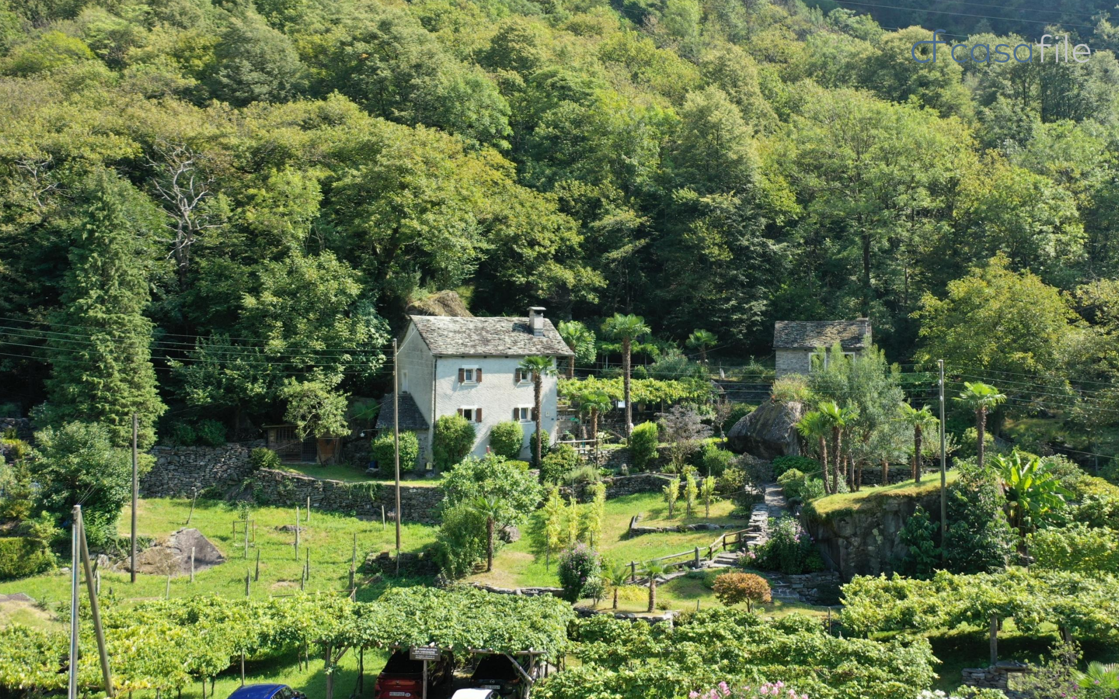
Schönes Rustico mit Naturkeller und grossem Garten Via Visletto 2, 6675 Cevio