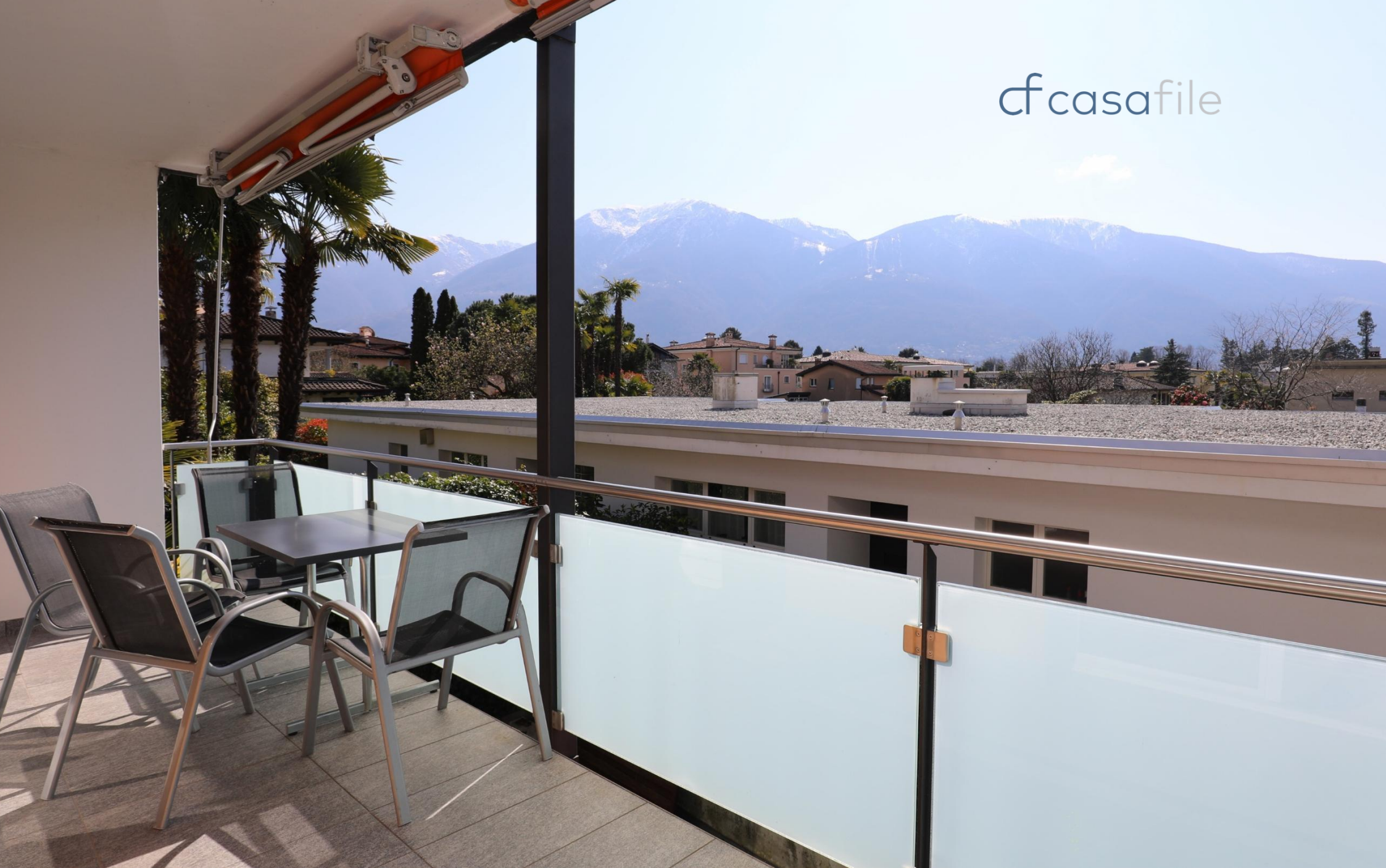
4.5-Zimmer Eigentumswohnung zentral gelegen in der Residenz Corallo Via Architetto Pisoni 5, 6612 Ascona