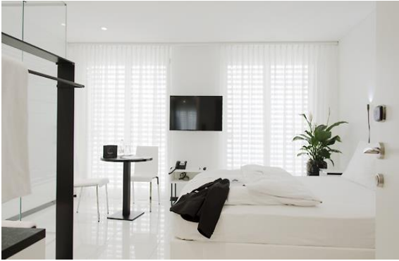
homeSTUDIO ohne Küche, mit Nutzung Loftküche 25 m2

Studios und Comfort-Studios sind ohne In-Room Küche, die sophie'sWOHNKÜCHE ist der Treffpunkt für alle geselligen Gäste die bei uns wohnen.