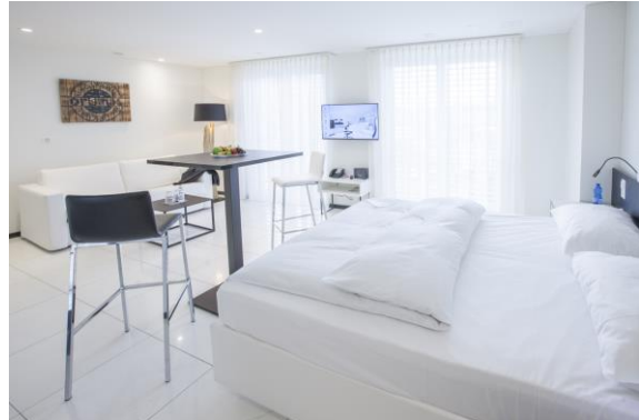
homeCOMFORT-STUDIO mit Kitchenette mit Nutzung Loftküche, 30 m2