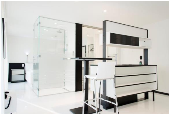
homeAPARTMENT mit In-Room Küche, 33-39 m2