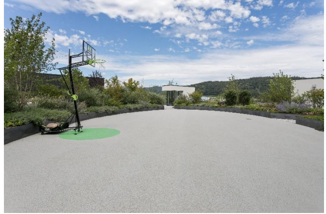
(Grillplatz bzw. Basketballplatz Dachgarten)