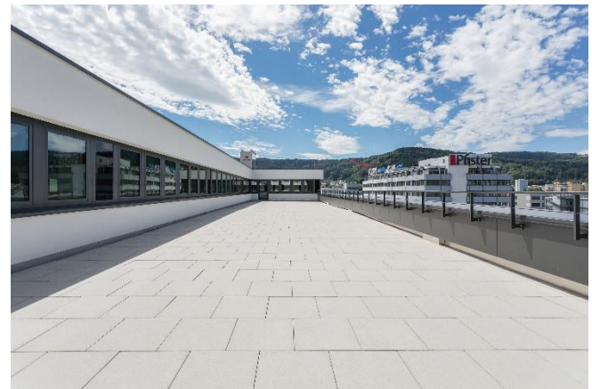
(Büro 6.OG bzw. Terrasse 6.OG; beides noch ohne Mieterflächentrennwände)