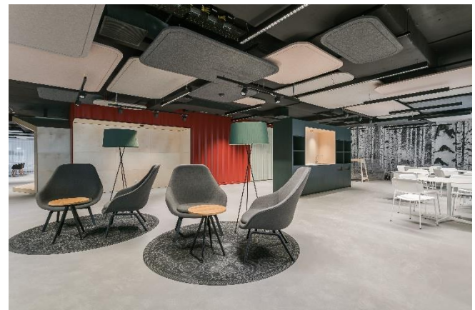
(Ein Sitzungszimmer von dreien in der Lobby bzw. Ausschnitt Lobbybereich)

Video des ECOPARK TIVOLI: https://youtu.be/99dj1S054o8