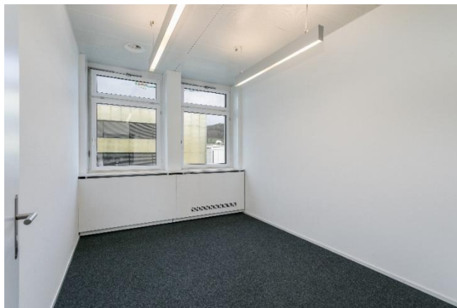
(Einzelraumbüro resp. Sitzungszimmer)