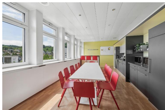
(Aufenthaltsraum mit Küche sowieausgebaute Toiletten-Anlagen)