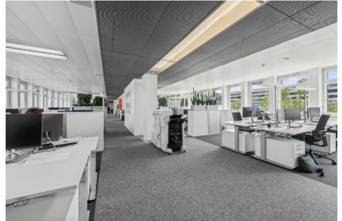
(Teeküche beim Haupteingang Kreuzweg 11 bzw. Grossraumbüro)