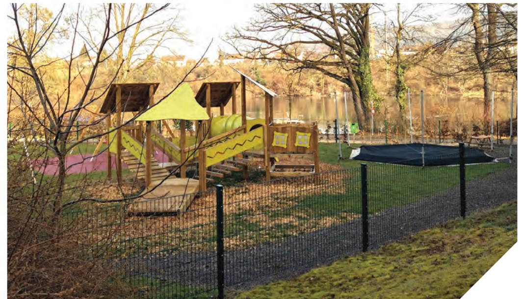
Aussensitzplatz mit Tischen und Bänken, sowie Spielplatz der hausinternen Kita