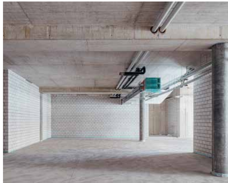
Objekt 10003 Haus Süd 1

WERDEN SIE TEIL DES QUARTIERS MIT IHREM BUSINESS!