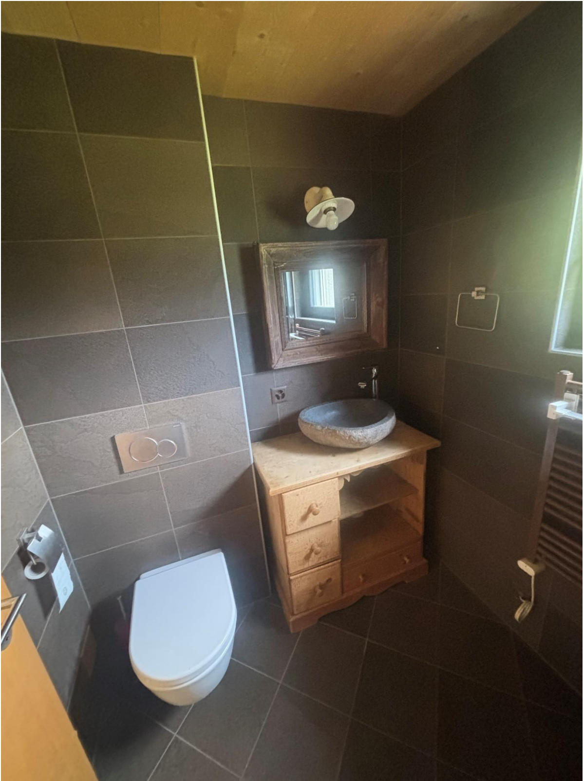
Salle de bains 2 avec baignoire