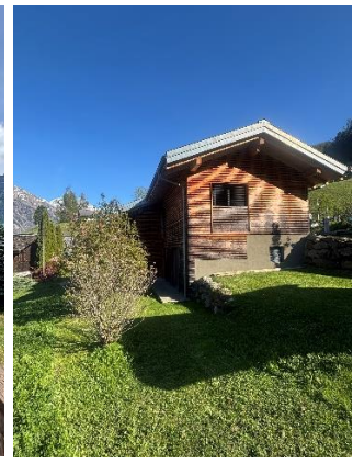
Jardin / extérieur