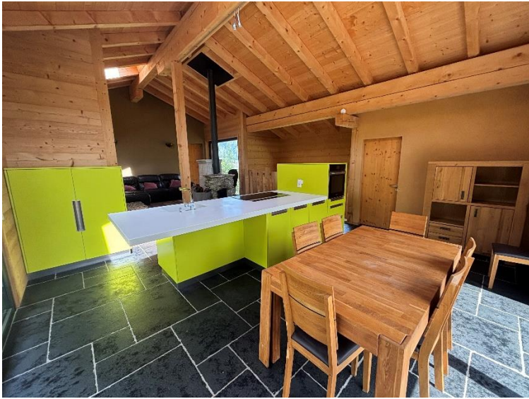
Séjour / cuisine / espace de vie

Le bien est également complété par un économat, espace bureau, une petite salle de sport avec sauna, une buanderie ainsi qu'un local technique, offrant un confort de vie optimal aussi bien au quotidien qu'en résidence secondaire.