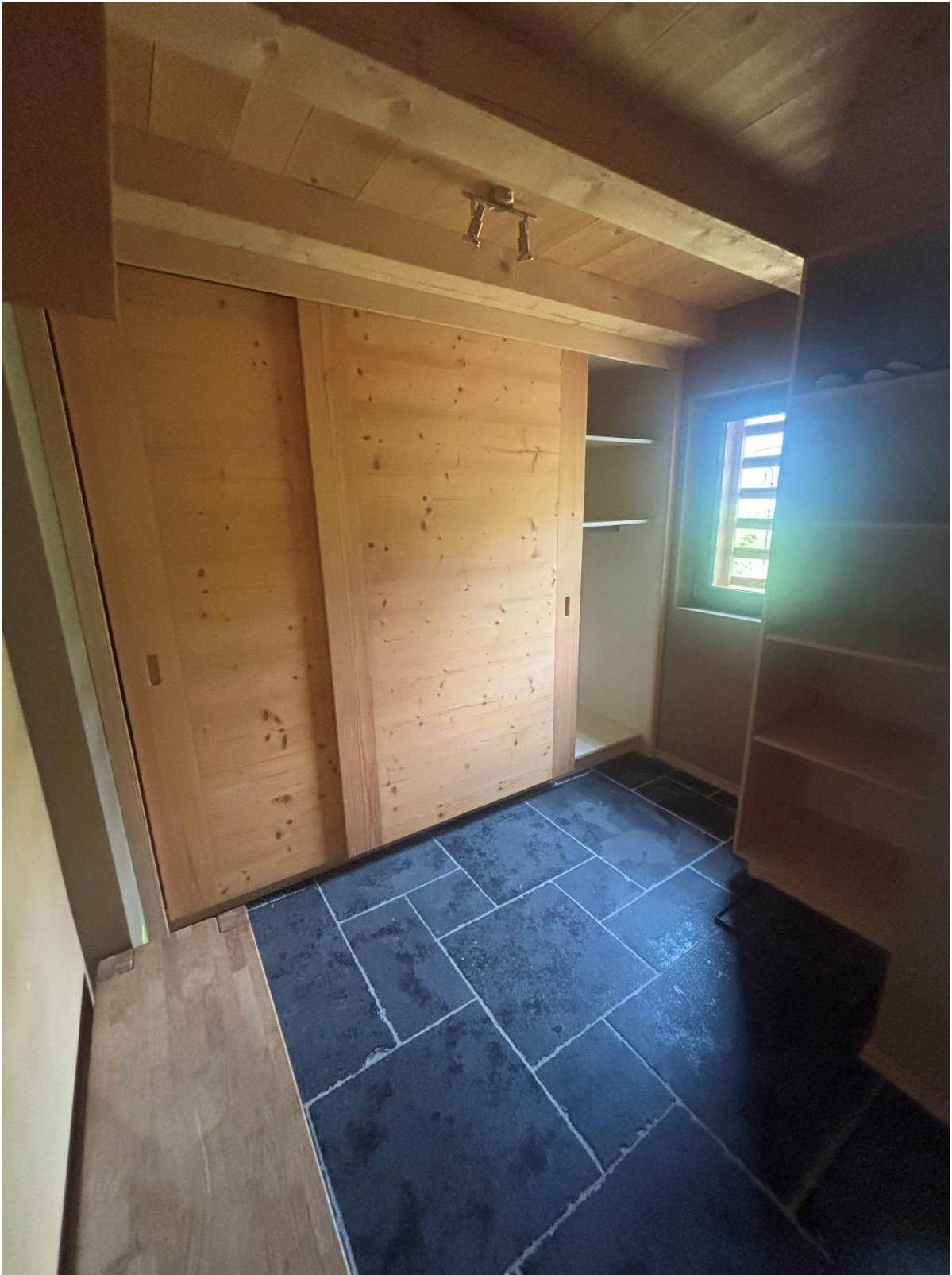
Entrée avec Rangements