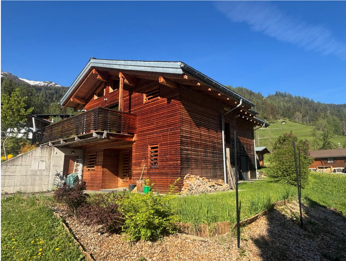
Façade du chalet / vue extérieure

Un bien rare au cœur du Val de Bagnes, avec vue panoramique et écologique