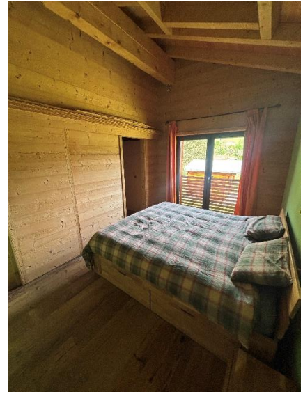
Suite parentale / chambre