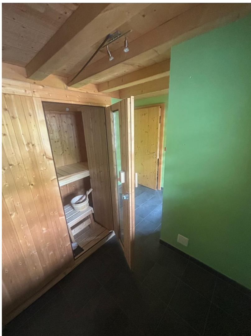
Sauna et space sport