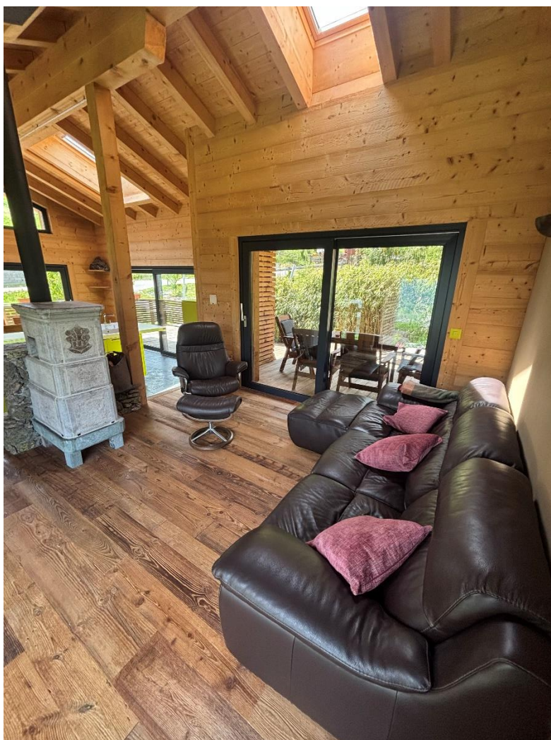
Salon avec une « bagnard »