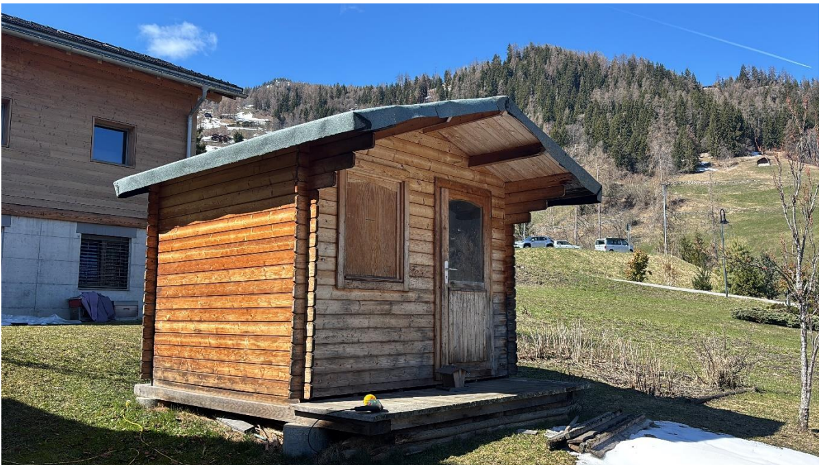
Cabanon de jardin