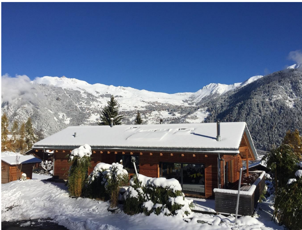
Vue sur les montagnes et le Val de Bagnes