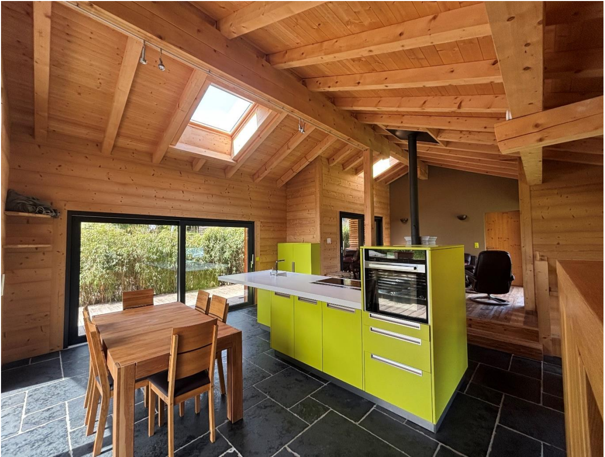
Autre vue intérieure