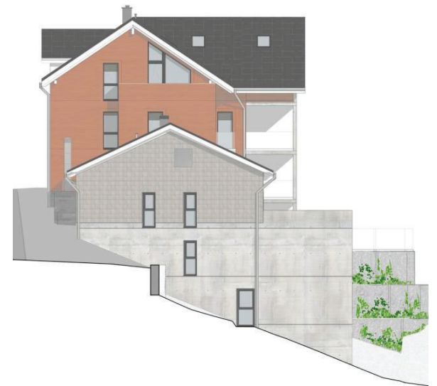
FASSADE WEST GARAGENGEBÄUDE 1:300