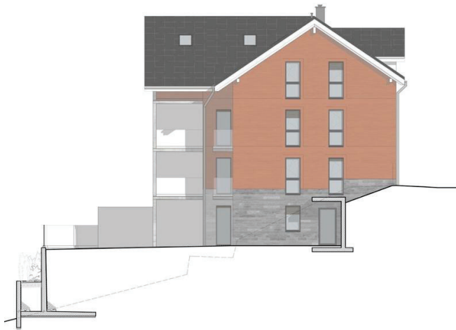
FASSADE OST WOHNGBÄUDE 1:300