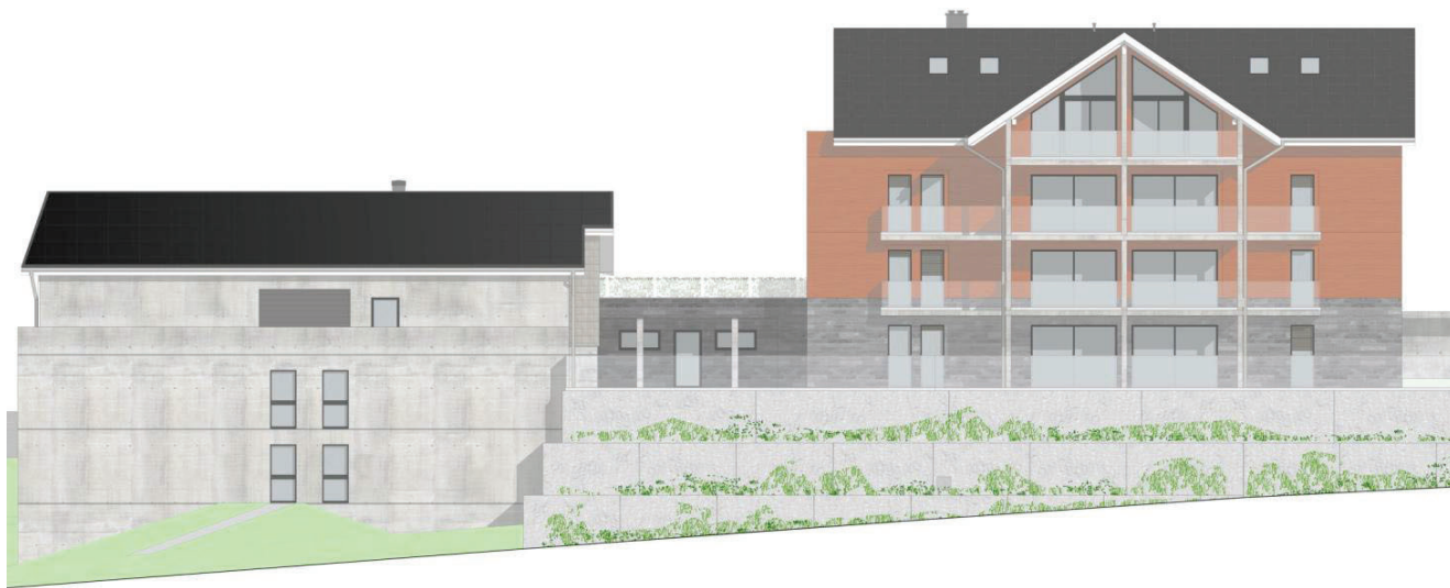
FASSADE SÜD WOHN- UND GARAGENGEBÄUDE 1:300