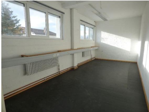
Sep. Büro (Obergeschoss)