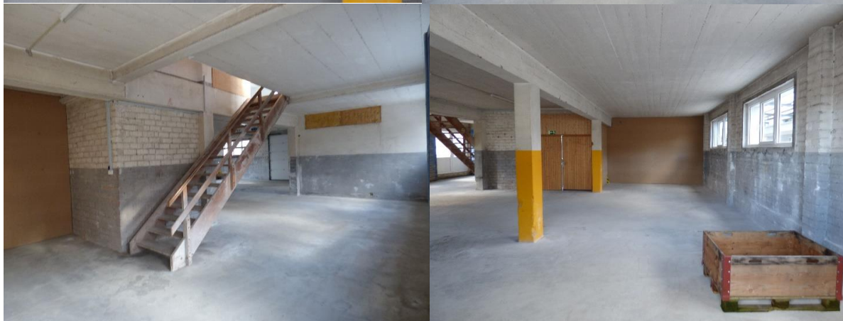
Lagerfläche mit Garagentor und Flügeltüre (Parterre)