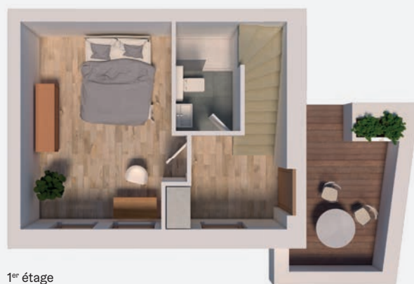
1 er étage