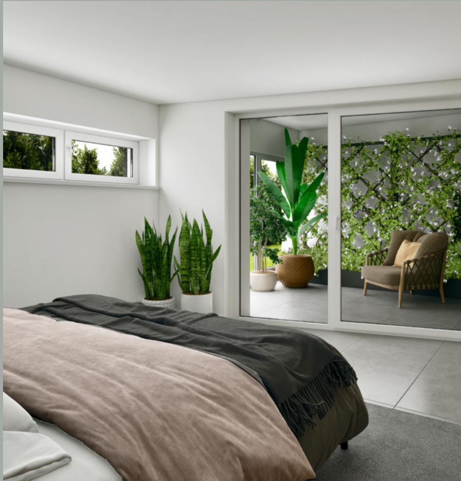
OBJEKT B // SCHLAFEN & SITZPLATZ UG