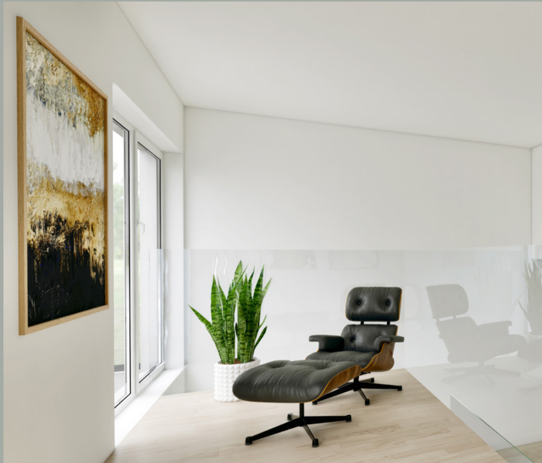
OBJEKT D // LESEN GALERIE