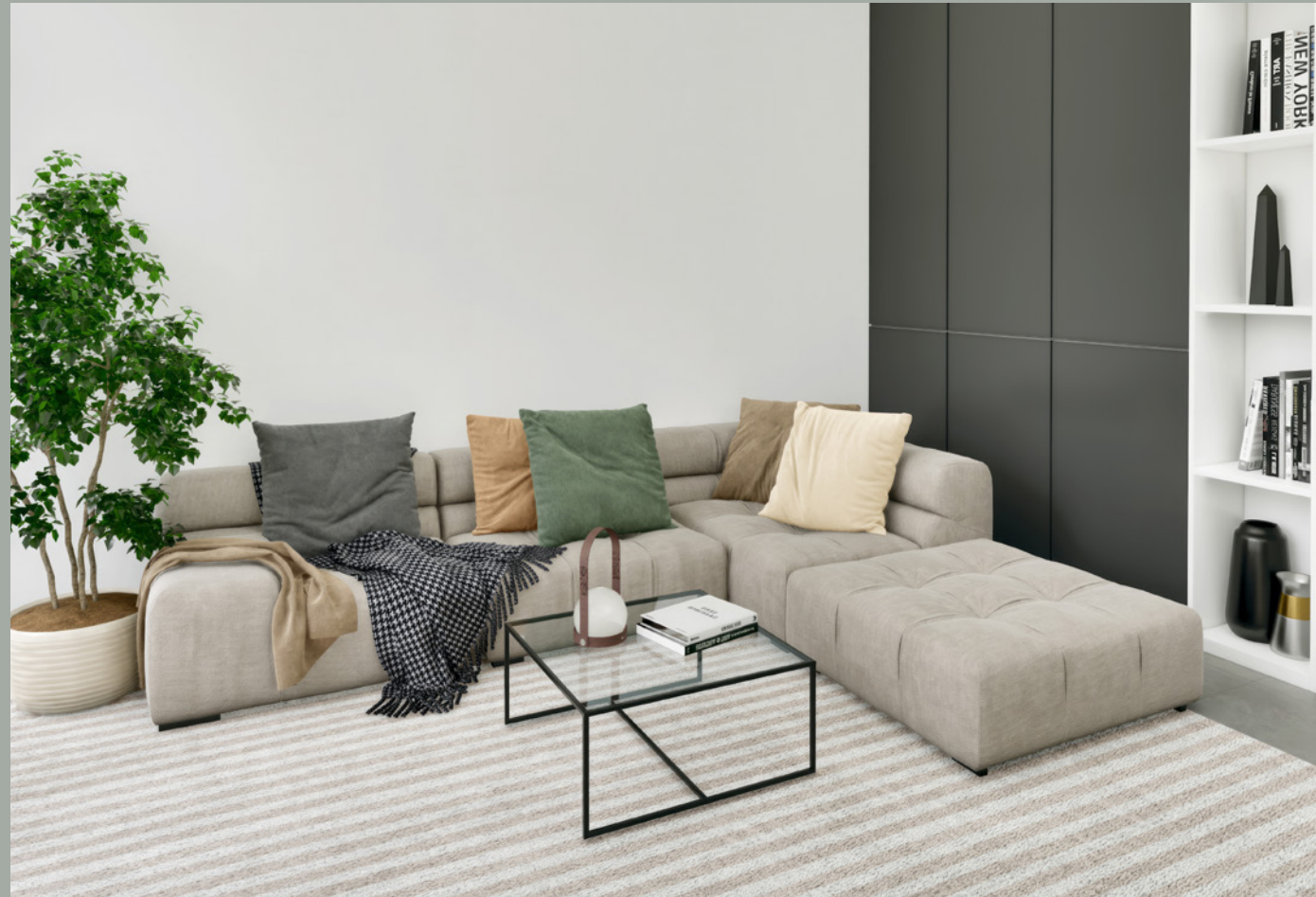
OBJEKT A // WOHNEN EG