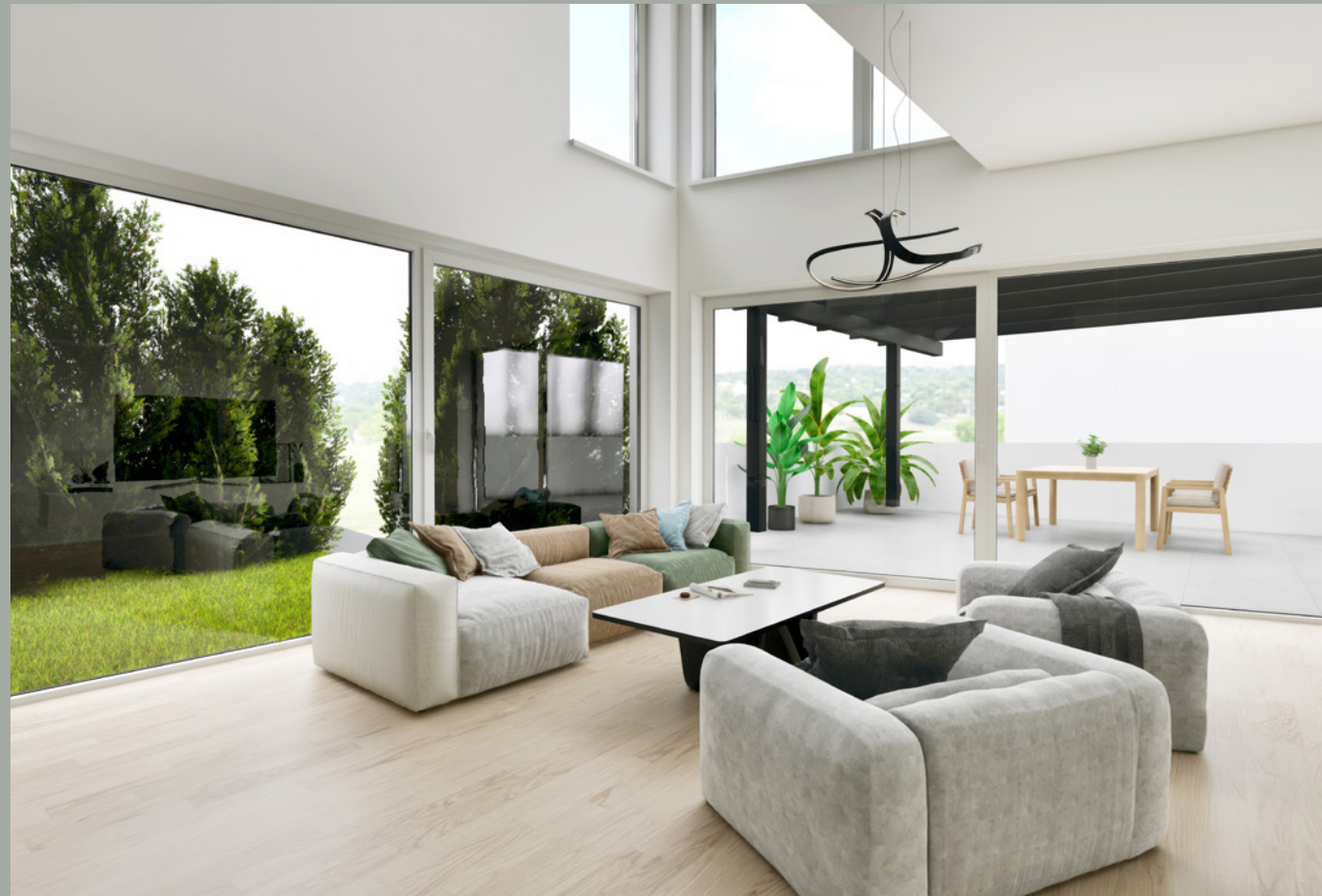
OBJEKT 1 // WOHNEN