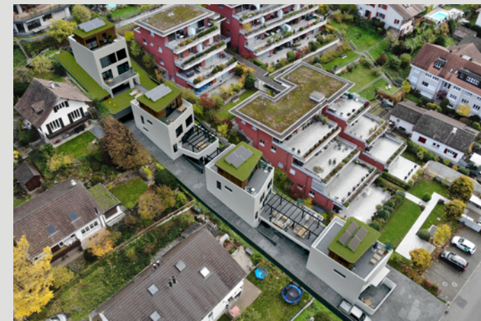
PROJEKT // VOGELPERSPEKTIVE