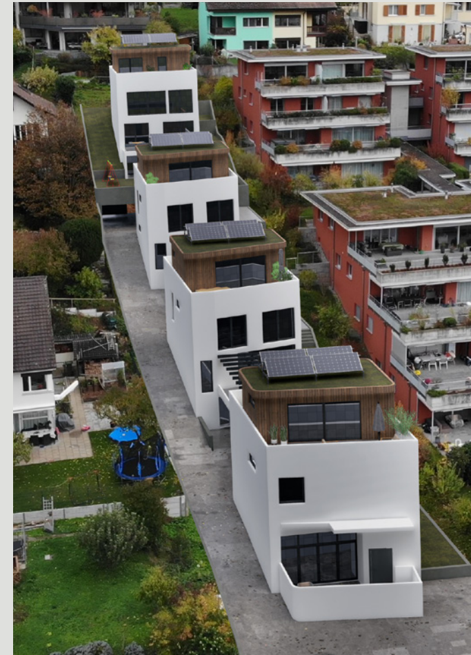
PROJEKT // AUSSENANSICHT

Das Solarpotential am Gebäude wird voll ausgenutzt. Das Dach ist vollständig mit Photovoltaik-Modulen (PV) belegt.