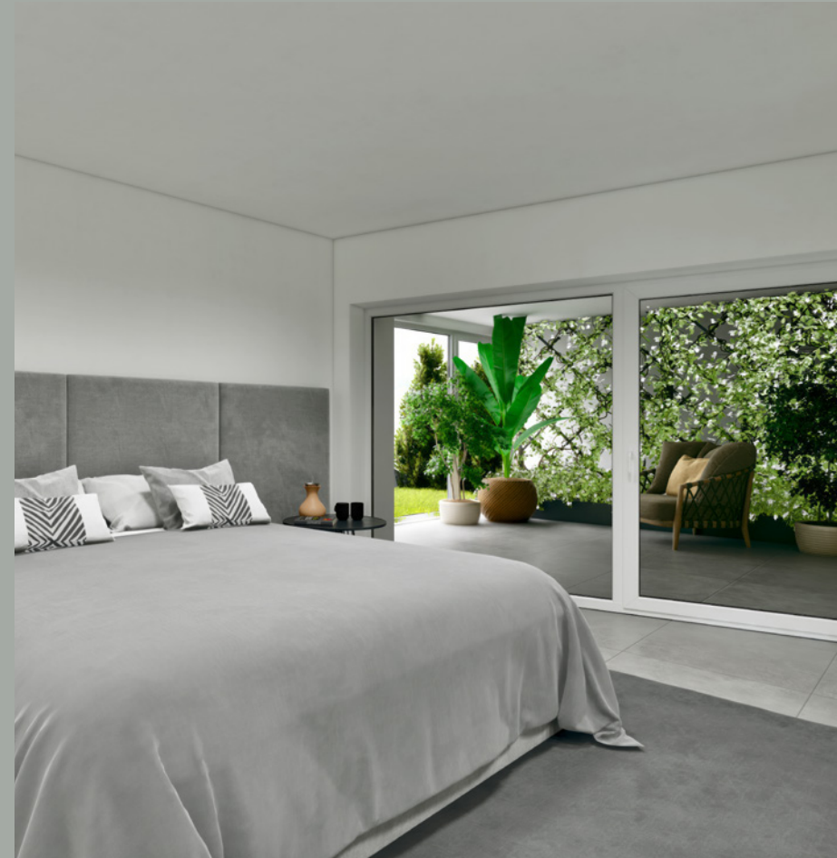
OBJEKT C // SCHLAFEN UG