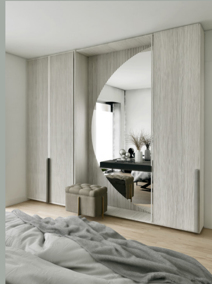
OBJEKT D // SCHLAFEN 2.0G