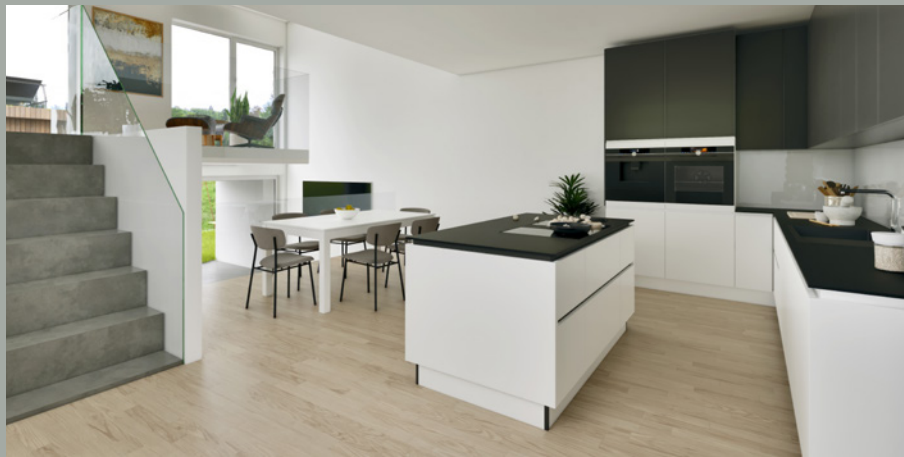
OBJEKT D // LESEN & KOCHEN 1.OG