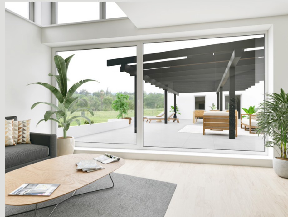
OBJEKT B // WOHNEN 1. OG

Im sonnenverwöhnten Füllinsdorf entstehen an der Mühlemattstrasse 28 vier moderne und hochwertige 5,5-7-Zimmer-Häuser. Von wunderbaren Naherholungsgebieten zu einem lebhaften Geschäftsquartier, hier lässt sich Alltag und Freizeit gut in Balance halten. Im familienfreundlichen Quartier, an leichter Hanglage, lässt die ideale Ausrichtung der Häuser sowie deren Gestaltung Ihre Augen strahlen. Raumhohe Fenster durchfluten die Innenräume mit warmem und natürlichem Tageslicht und sorgen für ein stimmungshebendes Ambiente in Ihrem neuen Zuhause.