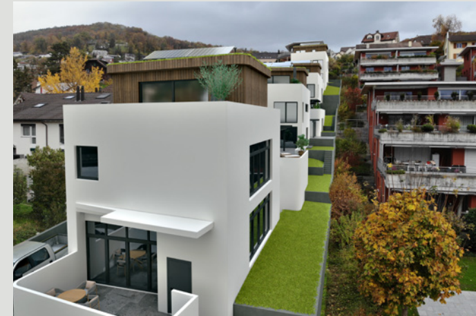
PROJEKT // SEITENANSICHT

In fossilfrei betriebenen, hocheffizienten Minergie-P-Gebäuden sind die mit der Gebäude-Erstellung verbundenen Treibhausgasemissionen besonders relevant. Entsprechend ist bei der Erstellung ein Grenzwert einzuhalten. Damit werden Anreize für die Ressourceneffizienz und eine klimafreundliche Materialauswahl gesetzt.