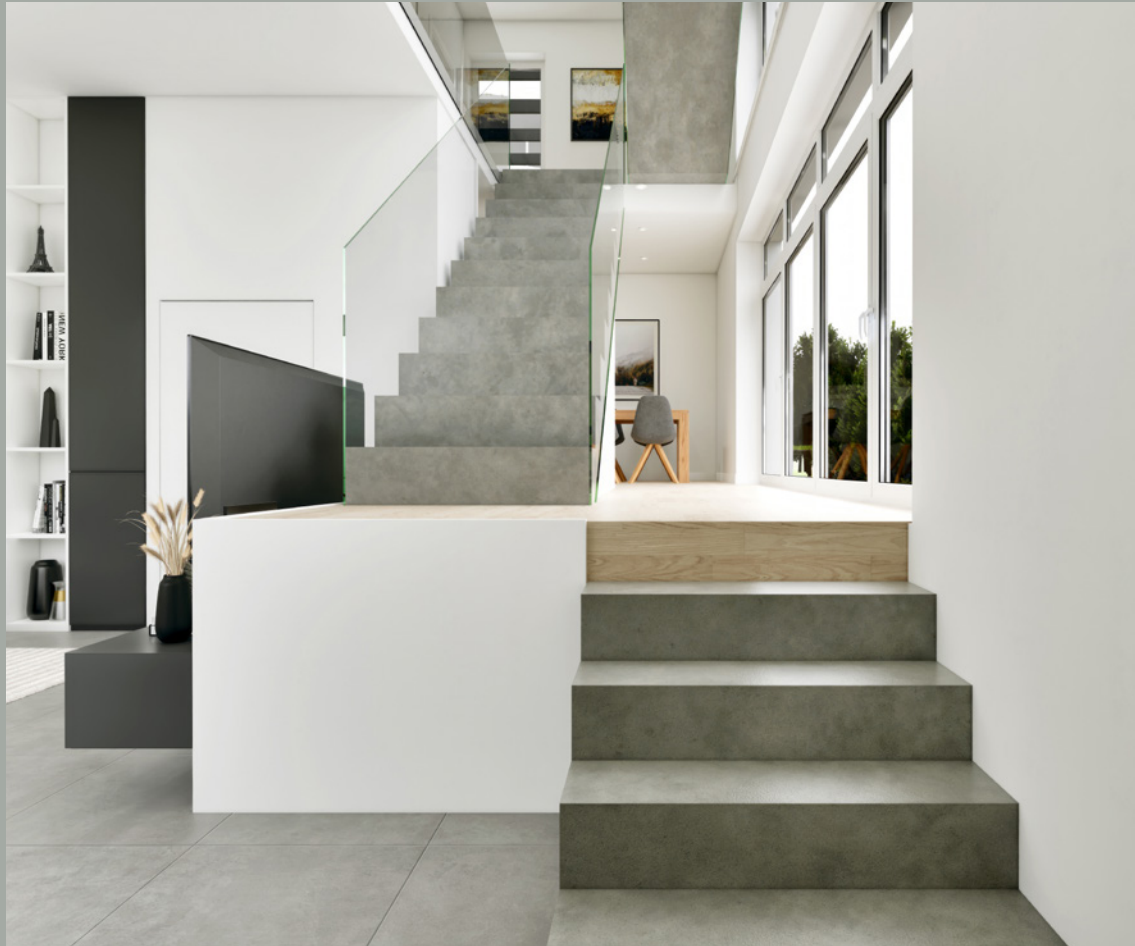
OBJEKT A // ENTRÉE