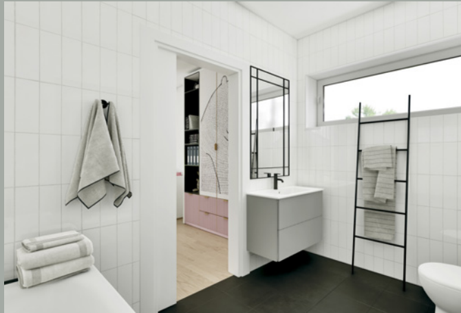
OBJEKT C // BADEZIMMER 1.0G