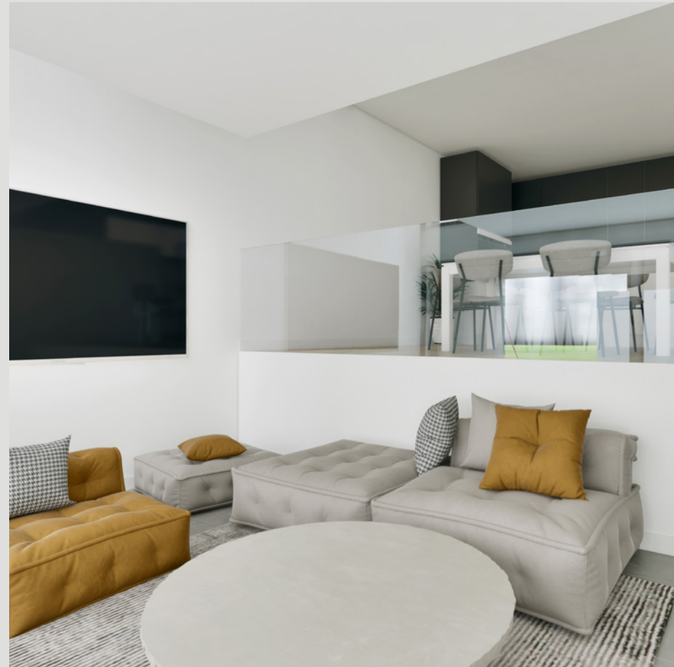
OBJEKT D // WOHNEN & ESSEN

Für noch mehr Lebensqualität sorgen eine optimale Raumisolierung, eine integrierte Komfortlüftung sowie Solarpanels auf dem Dach. Das Haus ist mit dem Energielabel «Minergie-P», einer idealen Energiegewinnung und tiefem Energieverbrauch, versehen.