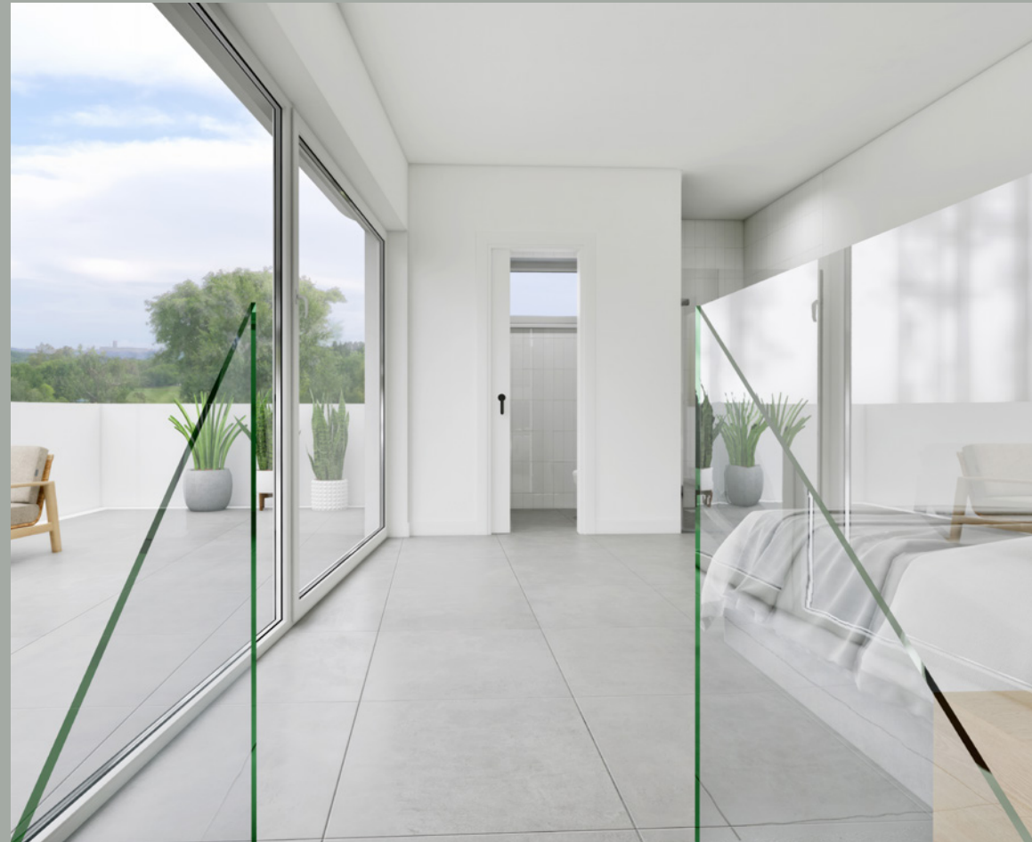
OBJEKT A // SCHLAFEN DG