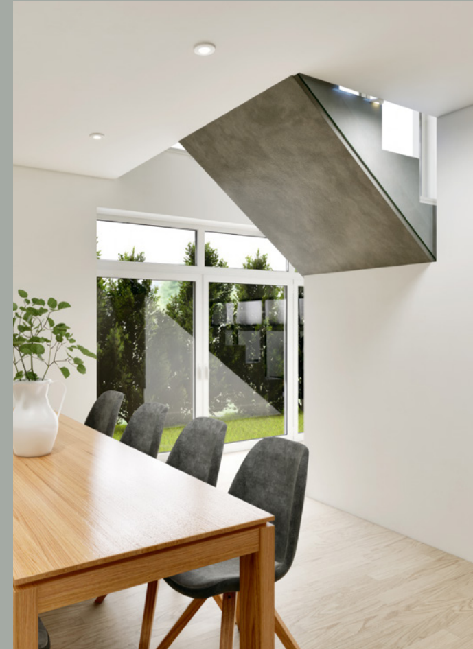
OBJEKT A // 1.0G