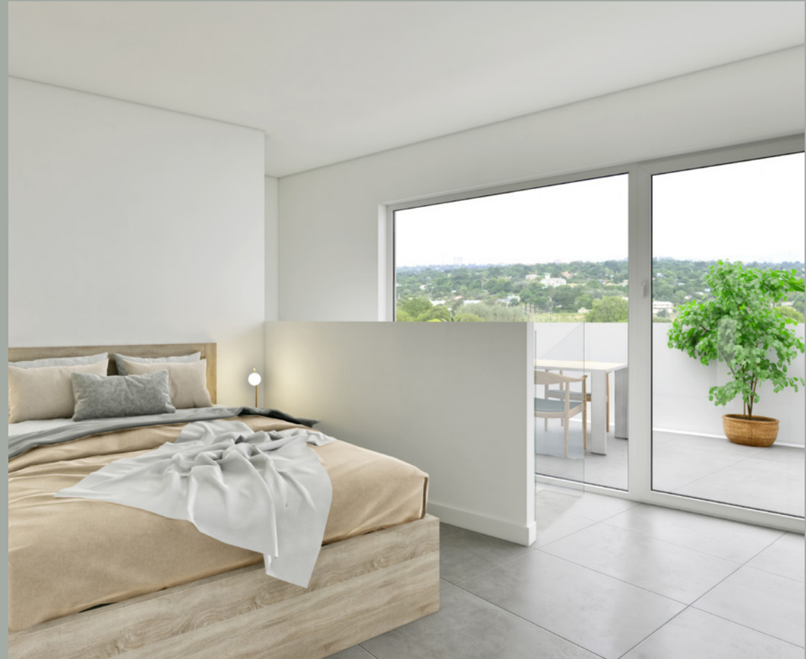
OBJEKT C // SCHLAFEN DG