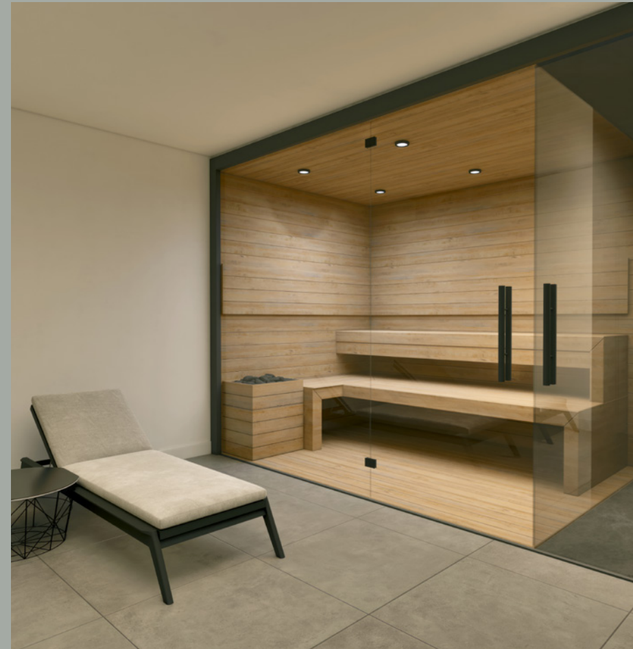
OBJEKT B // SAUNA UG