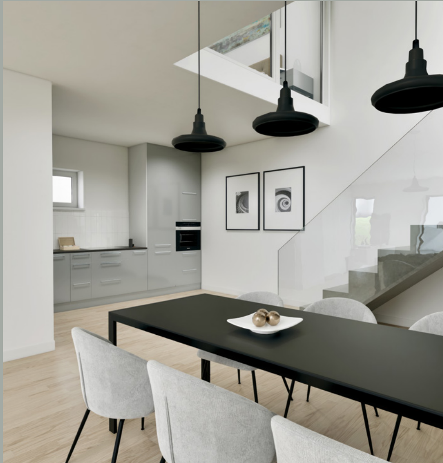
OBJEKT C // ESSEN 1.OG