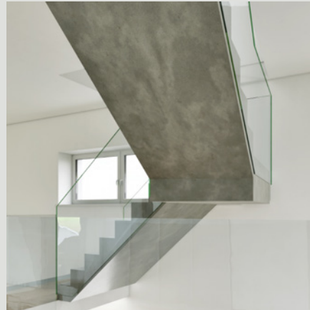
OBJEKT A // TREPPE 1. OG

Im sonnenverwöhnten Füllinsdorf entstehen an der Mühlemattstrasse 28 vier moderne und hochwertige 5,5-7-Zimmer-Häuser. Von wunderbaren Naherholungsgebieten zu einem lebhaften Geschäftsquartier, hier lässt sich Alltag und Freizeit gut in Balance halten. Im familienfreundlichen Quartier, an leichter Hanglage, lässt die ideale Ausrichtung der Häuser sowie deren Gestaltung Ihre Augen strahlen. Raumhohe Fenster durchfluten die Innenräume mit warmem und natürlichem Tageslicht und sorgen für ein stimmungshebendes Ambiente in Ihrem neuen Zuhause.