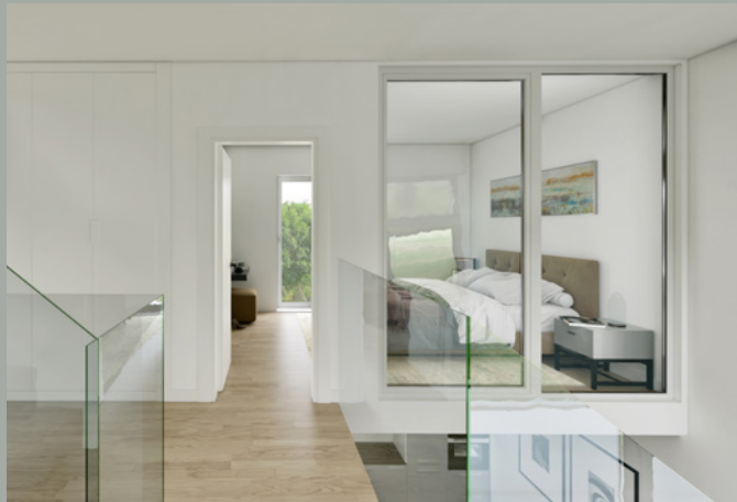
OBJEKT C // SCHLAFEN 1.0G