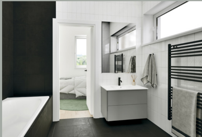
OBJEKT A // BADEZIMMER 1.OG