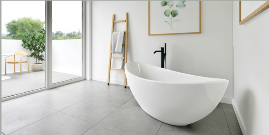
OBJEKT D // BADEZIMMER DG