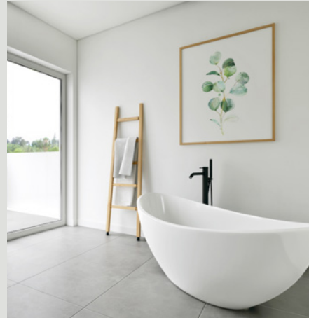
OBJEKT D // WC &amp; BAD

Selbstverständlich dürfen Sie auch ein höheres Budget für sich definieren, was zu entsprechenden Mehrkosten führt. Sollten Sie das Budget nicht ausnützen, so wird Ihnen der nicht gebrauchte Betrag gutgeschrieben.