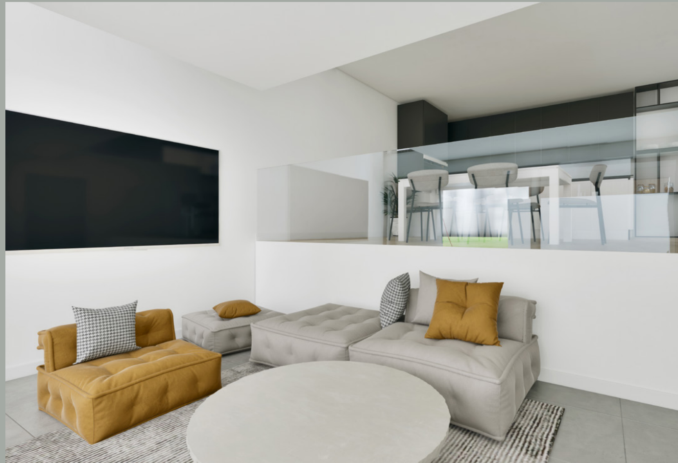
OBJEKT D // WOHNEN & ESSEN EG