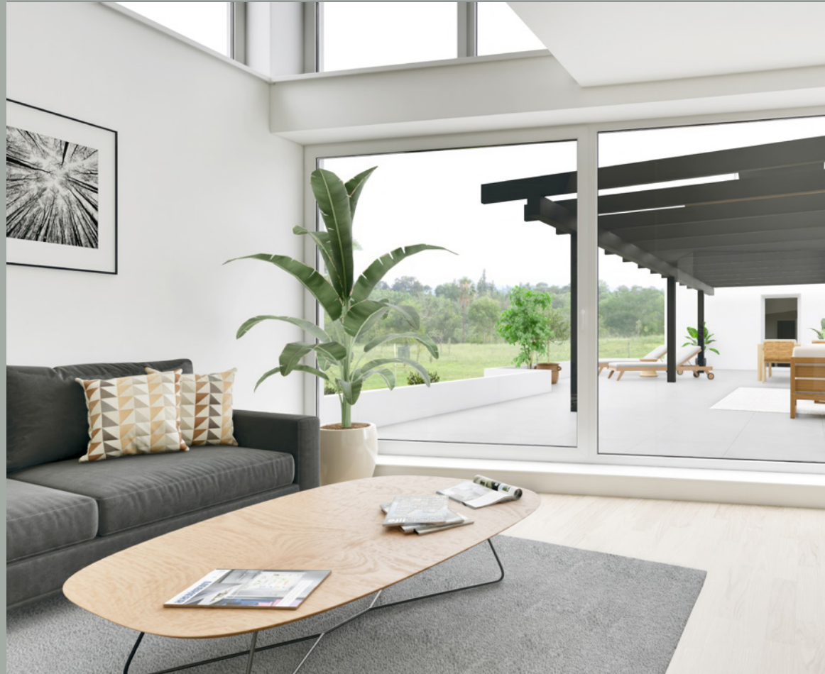
OBJEKT B // TERRASSE 1.OG