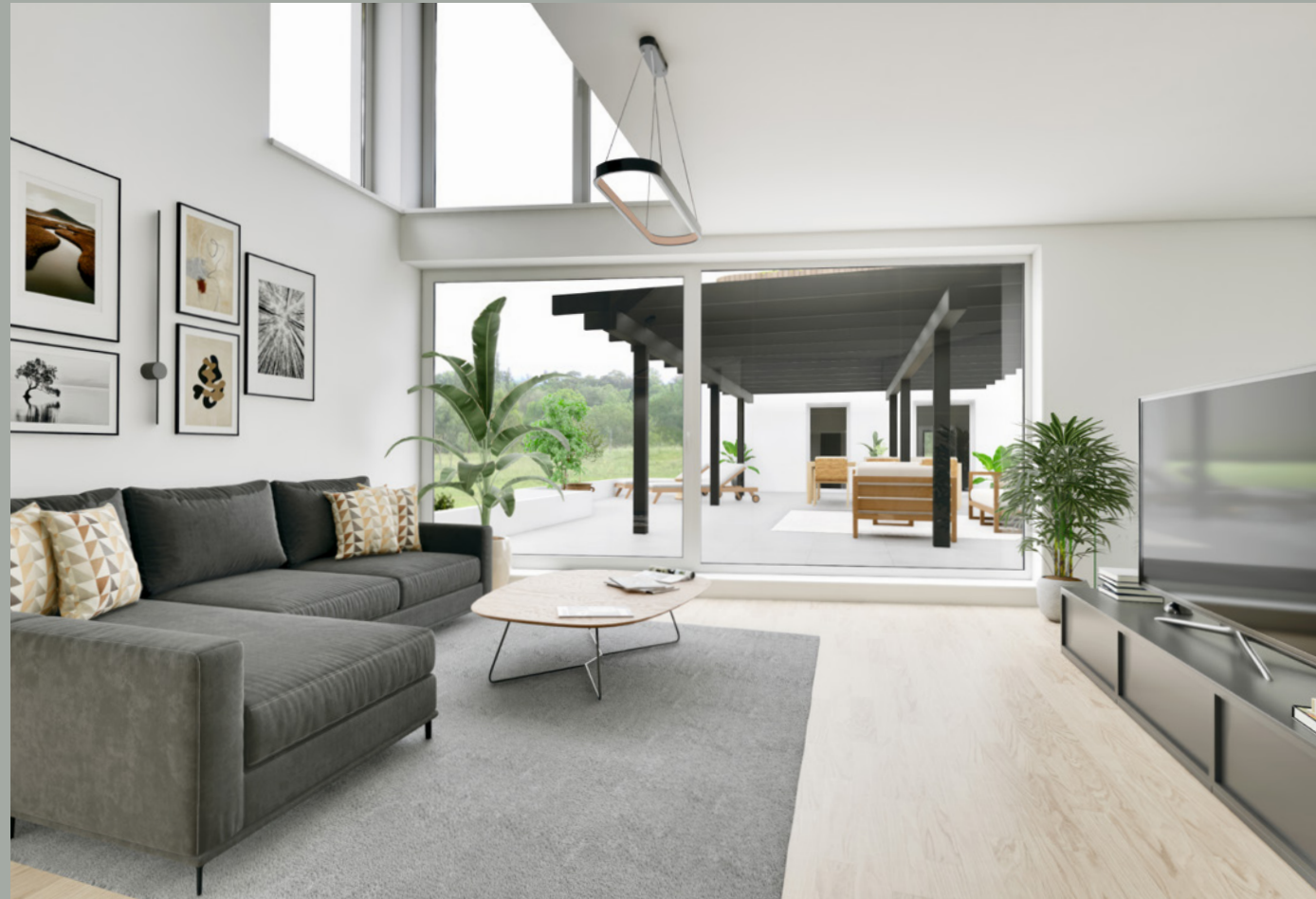
OBJEKT B // WOHNEN 1.OG