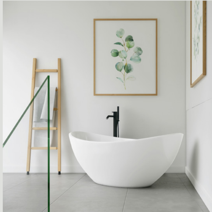
OBJEKT D // BADEN

Der Minergie-P-Standard hat die optimale Gebäudehülle. Wer maximale Energieeffizienz und Komfort sucht und wenig heizen möchte, wählt Minergie-P. Höchste Effizienz ist auch gut fürs Klima: Nicht gebrauchte Energie ist die beste Energie. Minergie-P-Gebäude werden auch im Jahre 2050 noch tauglich sein, sie erfüllen die Anforderung einer Netto-Null-Gesellschaft.