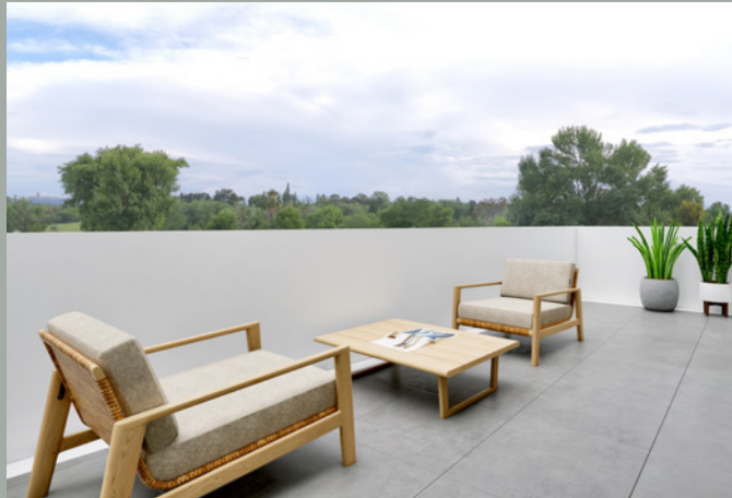
OBJEKT A // DACHTERRASSE