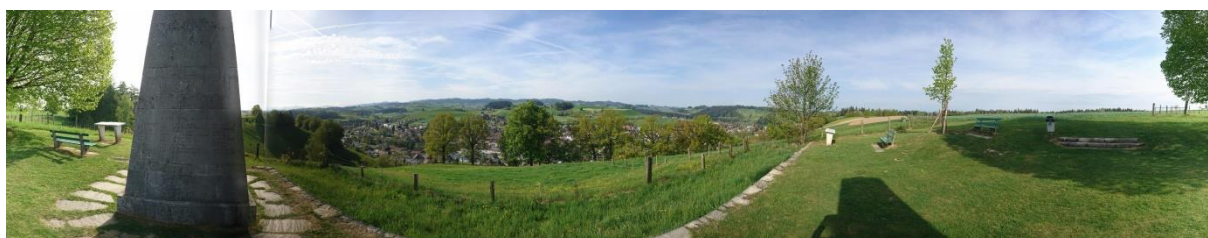
Sicht vom Huttwilberg Richtung Süden auf Huttwil und Umgebung

Das Gemeindegebiet umfasst 17.2 km 2 , knapp 20% davon sind Wald. Über 90 Vereine bieten Gelegenheit zur aktiven Teilnahme am kulturellen, sportlichen oder gemeinnützigen Leben. Vom Spätsommer bis ins Frühjahr kann Eislauf in der Eissporthalle und im Sommer Schwimmen im erneuerten Freiluftbad betrieben werden. Vielfältige Einkaufsmöglichkeiten bieten Angebote weit über den täglichen Bedarf hinaus, Coop, Migros und Landi sind mit grösseren Einkaufsläden präsent. Die Schulen werden von rund 680 Kindern und Jugendlichen aus Huttwil und umliegenden Gemeinden besucht. Sicherheit bietet das gute medizinische Angebot.