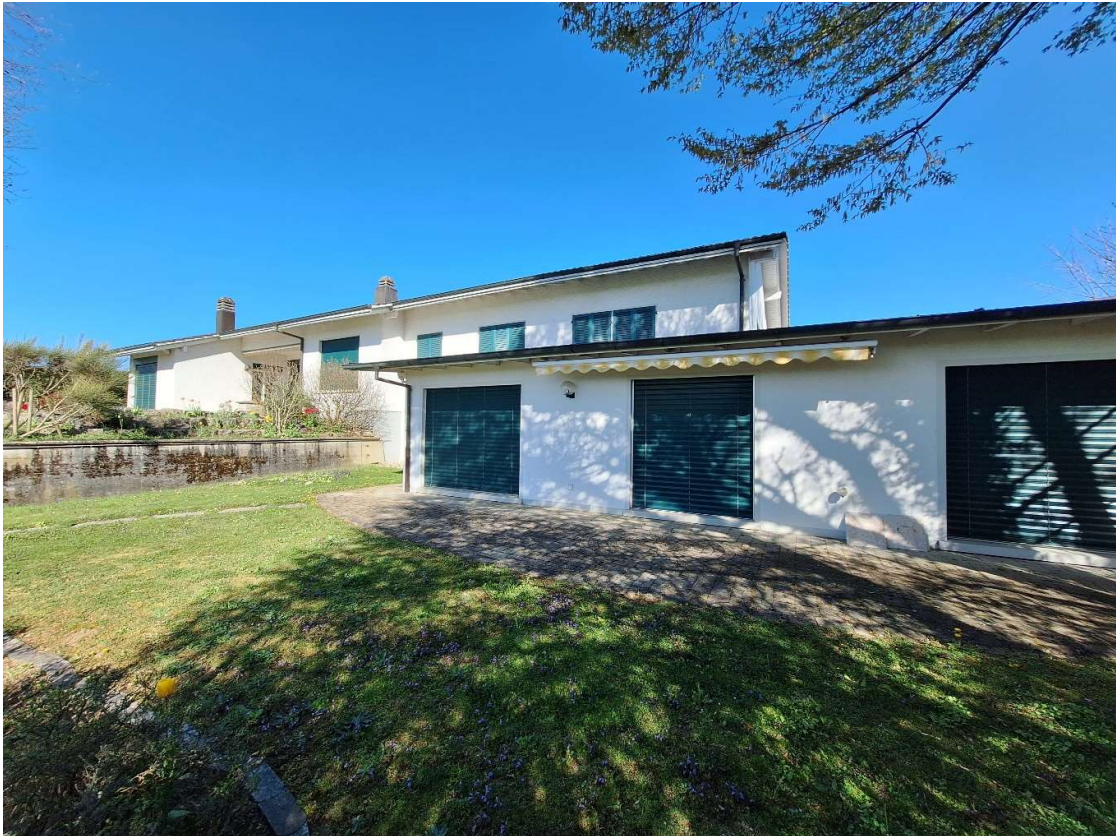
Sitzplatz vor Einliegerwohnung mit Sicht in Garten