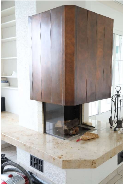
Cheminée im Wohnzimmer