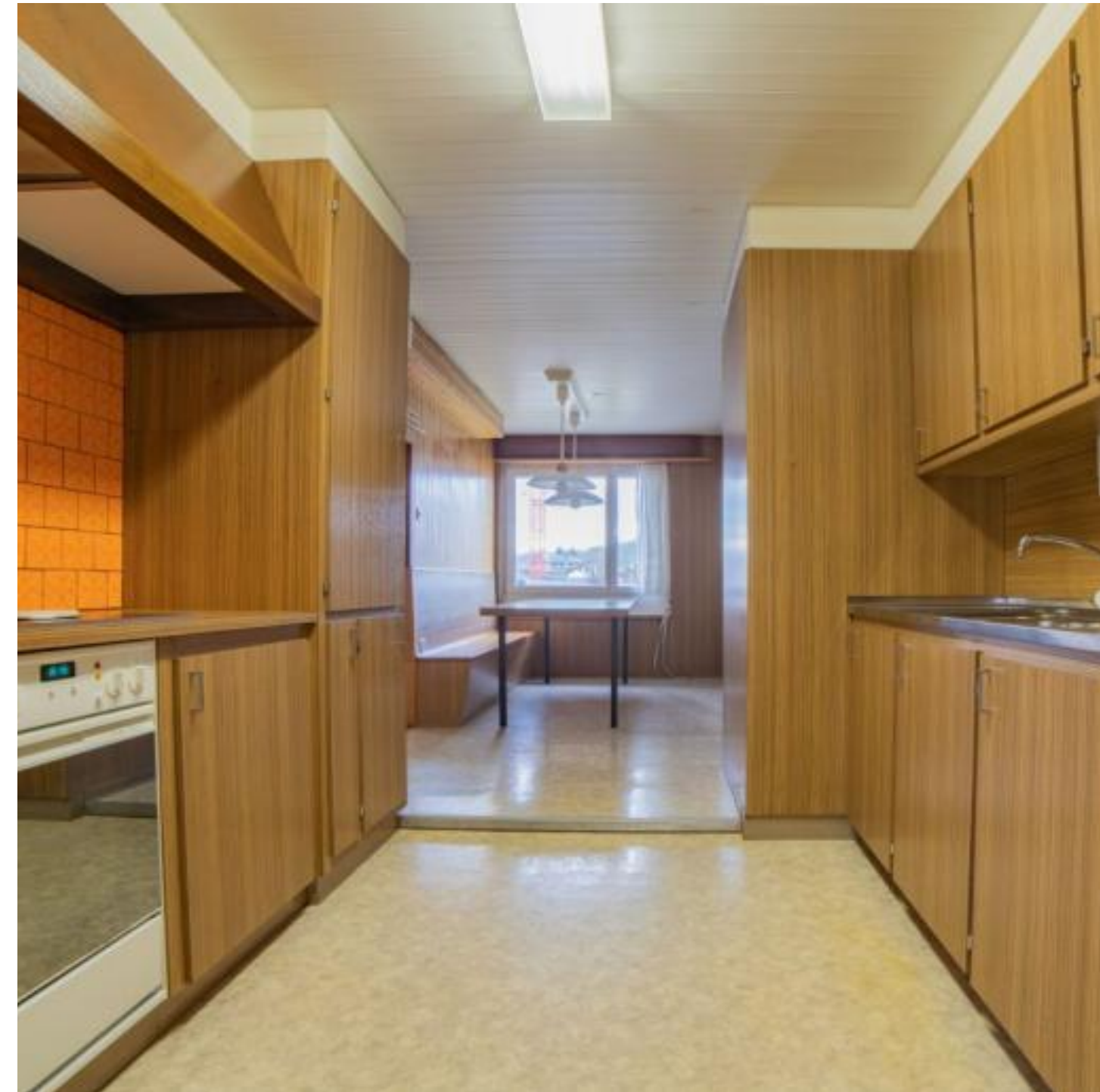
Küchen- und Essbereich