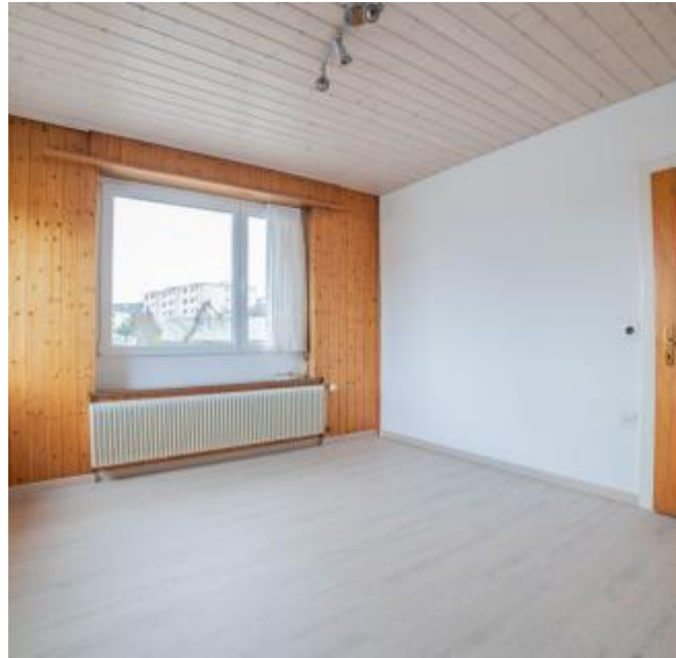
Ideal zur Umsetzung eigener Wohnideen