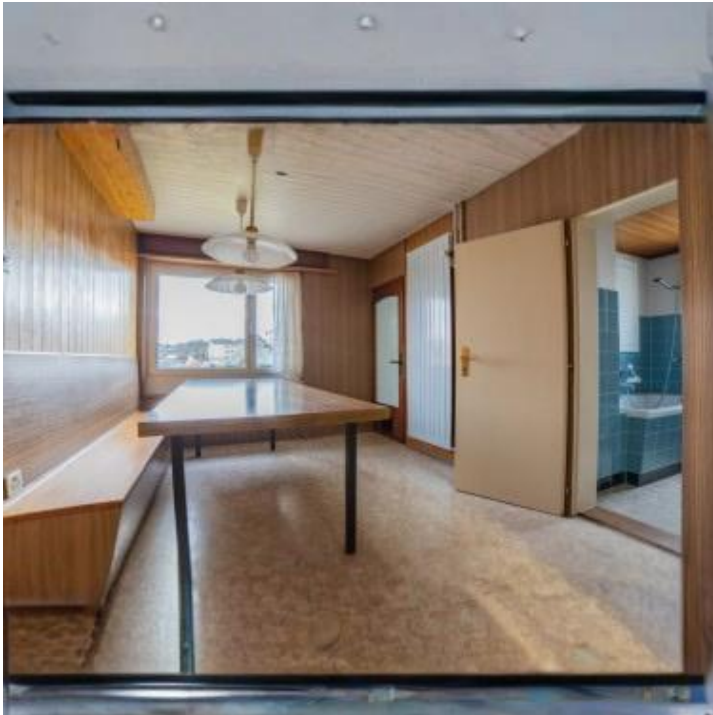
Gemütlicher Essbereich zum Beisammensein