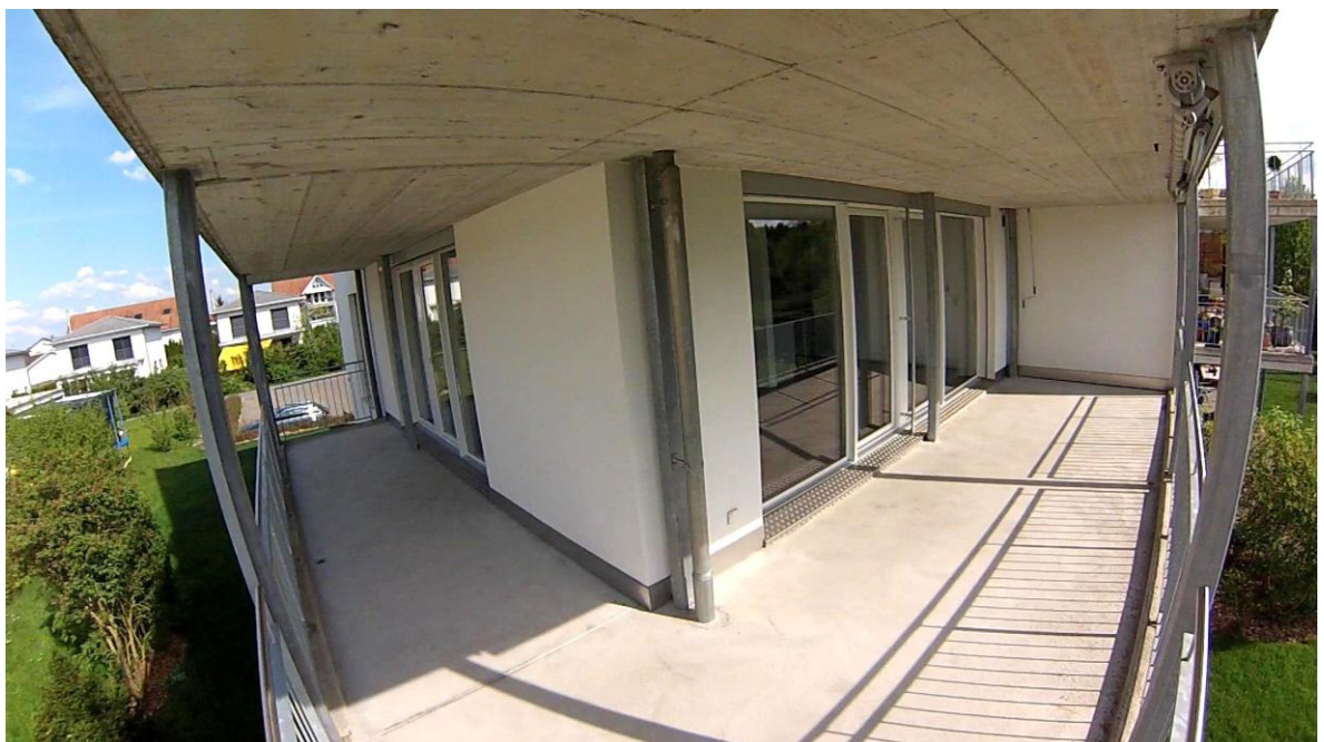
Kurzbeschreibung + Bewerbung 4.5-Zi-Wohnung, 1.OG Rechts, Hasenmattstr.13M, 3427 Utzenstorf