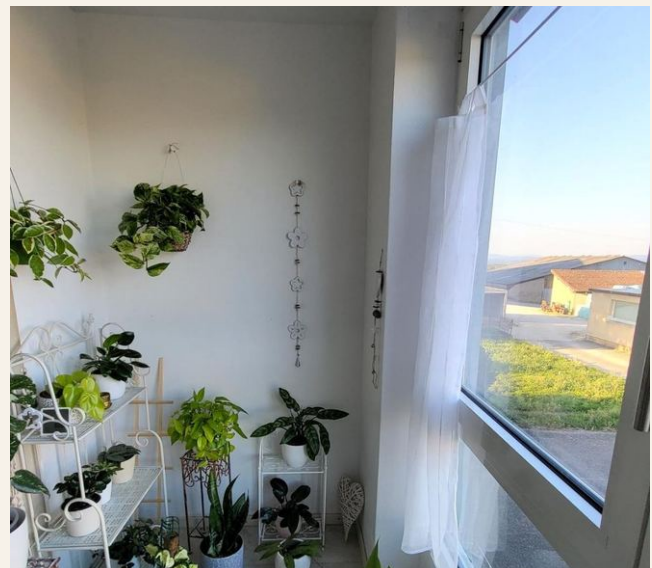
Kleiner Wintergarten mit Pflanzen