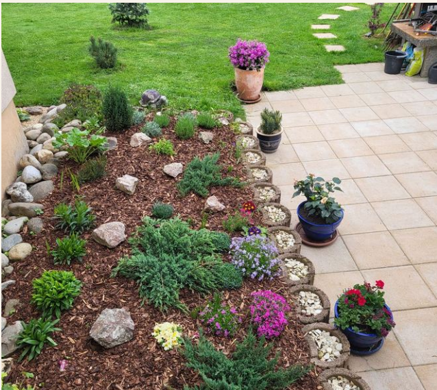
Steingarten mit Blumenbeet