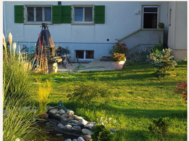
Garten Süd mit Biotop