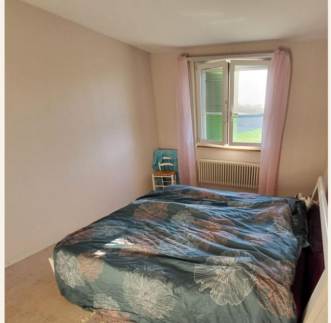
Schlafzimmer mit Korkboden, 1. Stock