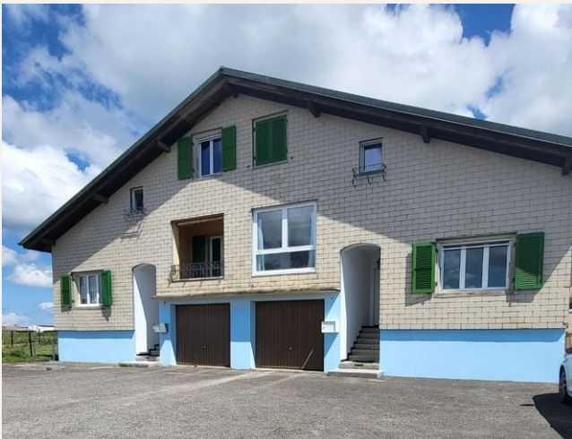
Frontansicht Westen mit Fensterläden aus Metall