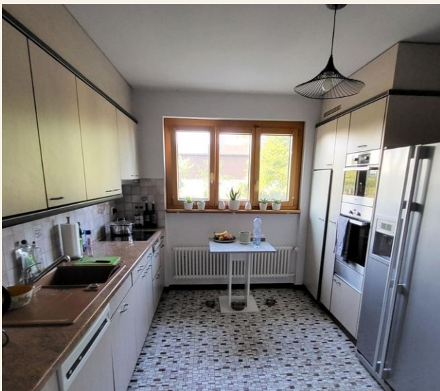
Küche mit hochwertigen Geräten