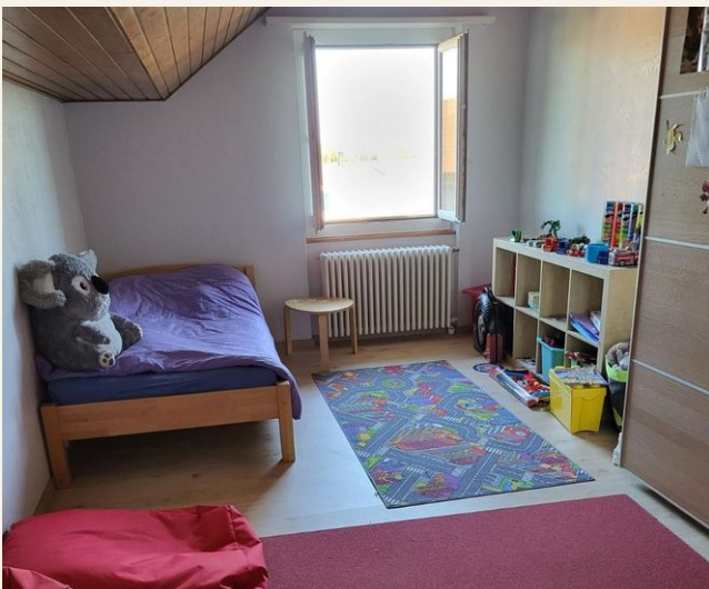
Kinderzimmer, 2. Stock