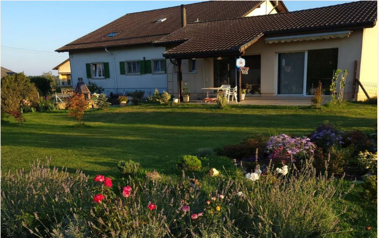
Süd-Ansicht mit gedeckter Veranda / Terrasse und angebautem Hallenbad