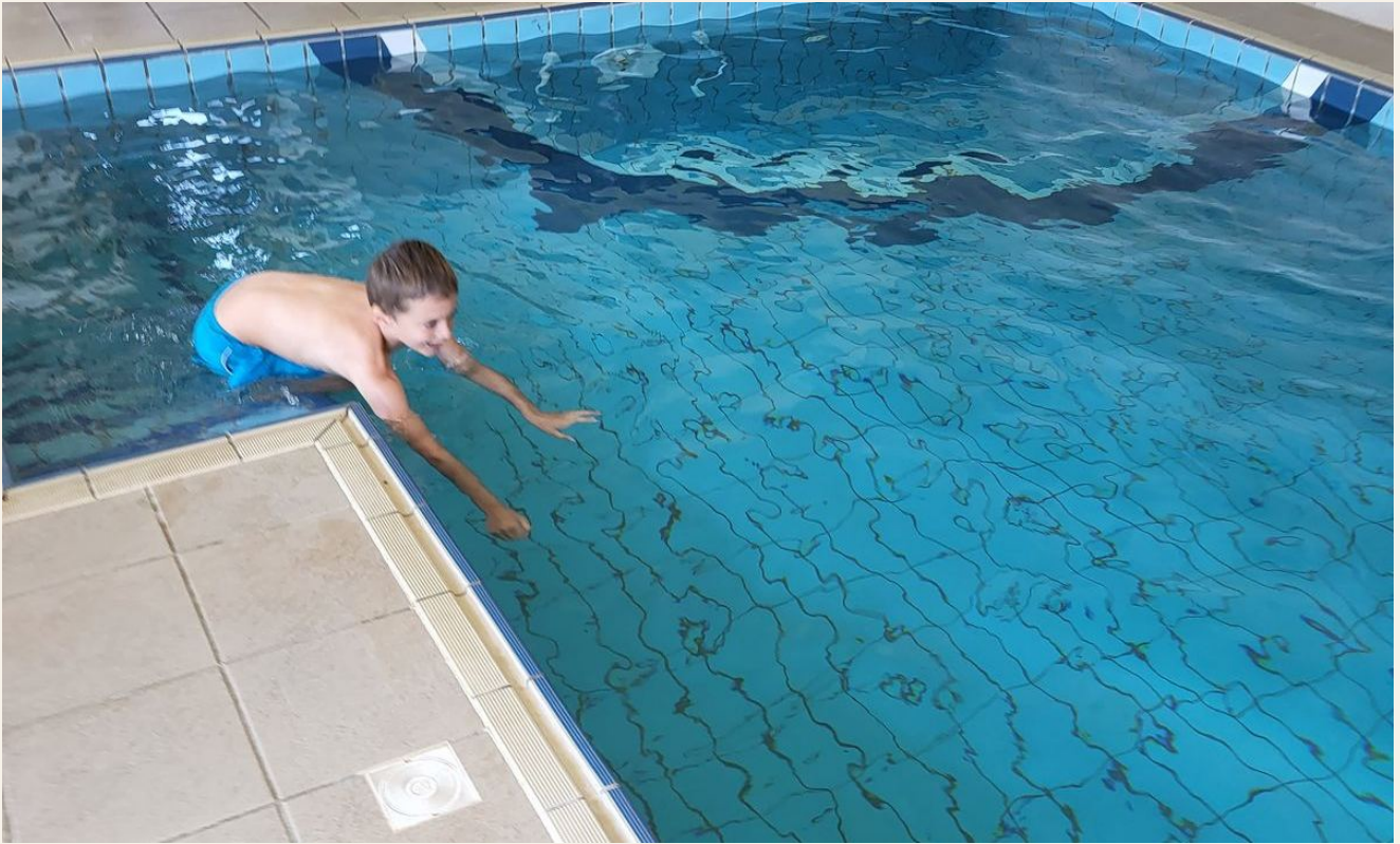
Hallenbad mit Jacuzzi