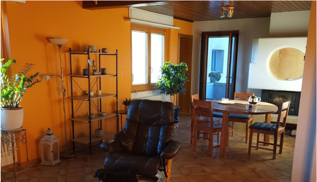
Wohnzimmer mit Cheminée und Durchgang zum Hallenbad und Garten