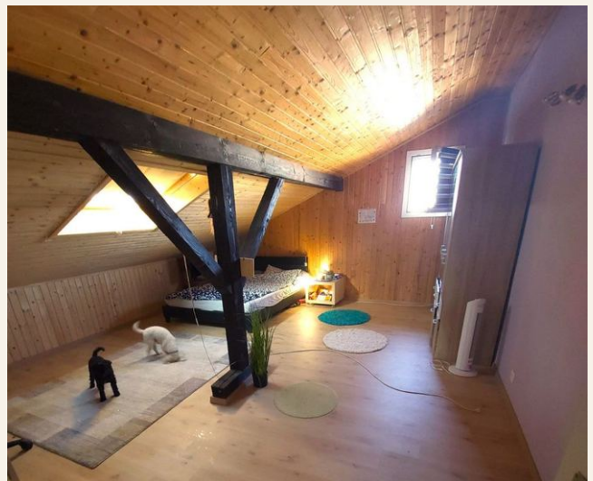
Frisch renoviertes grosses Zimmer mit Holzbalken, 1. Stock