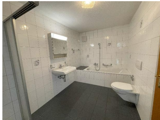
Bad / Dusche