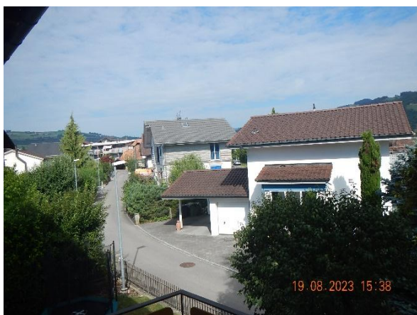
Aussicht Balkon Wohnzimmer