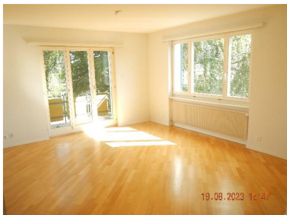
Wohnzimmer mit kleinem Balkon