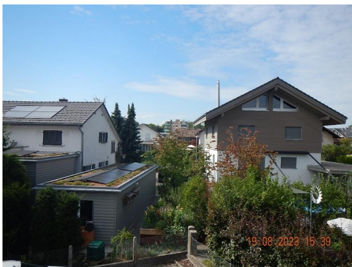
Aussicht Balkon Küche