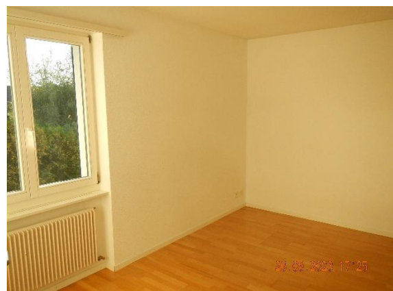
Kinderzimmer 2 mit Einbauschränk