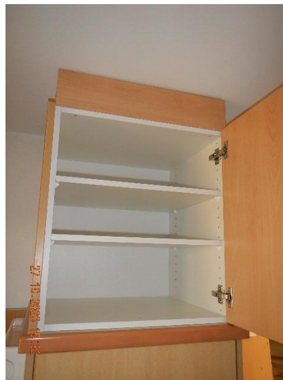
Ausbau Oberschränke 2023: