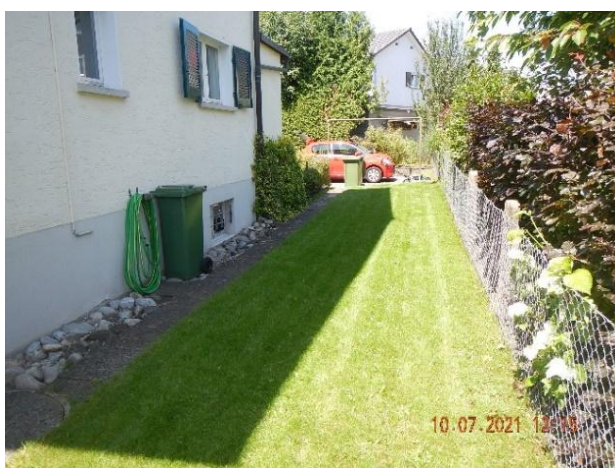
Rasenanteil Wohnung OG