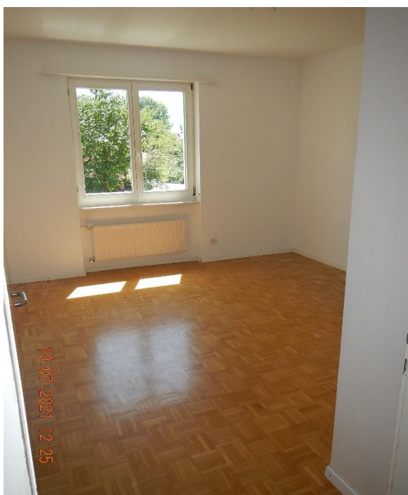
Kinderzimmer 1 mit Einbauschränk