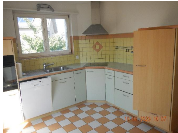
Küche mit kleinem Balkon