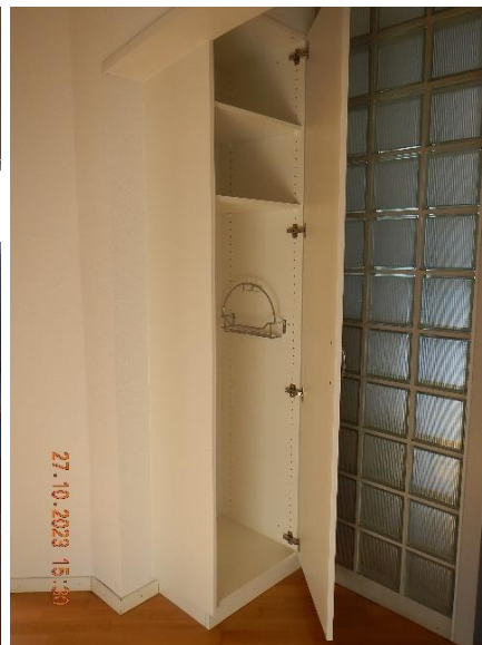
Neuer Putzschrank 2023