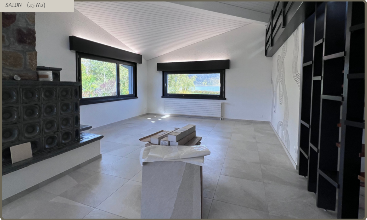
SALON (45 M2)

Grande pièce à vivre avec une hauteur de plafond importante. Un grand poêle à bois en faïence agrémente l'atmosphère. Une mezzanine bien cosy plonge sur le séjour