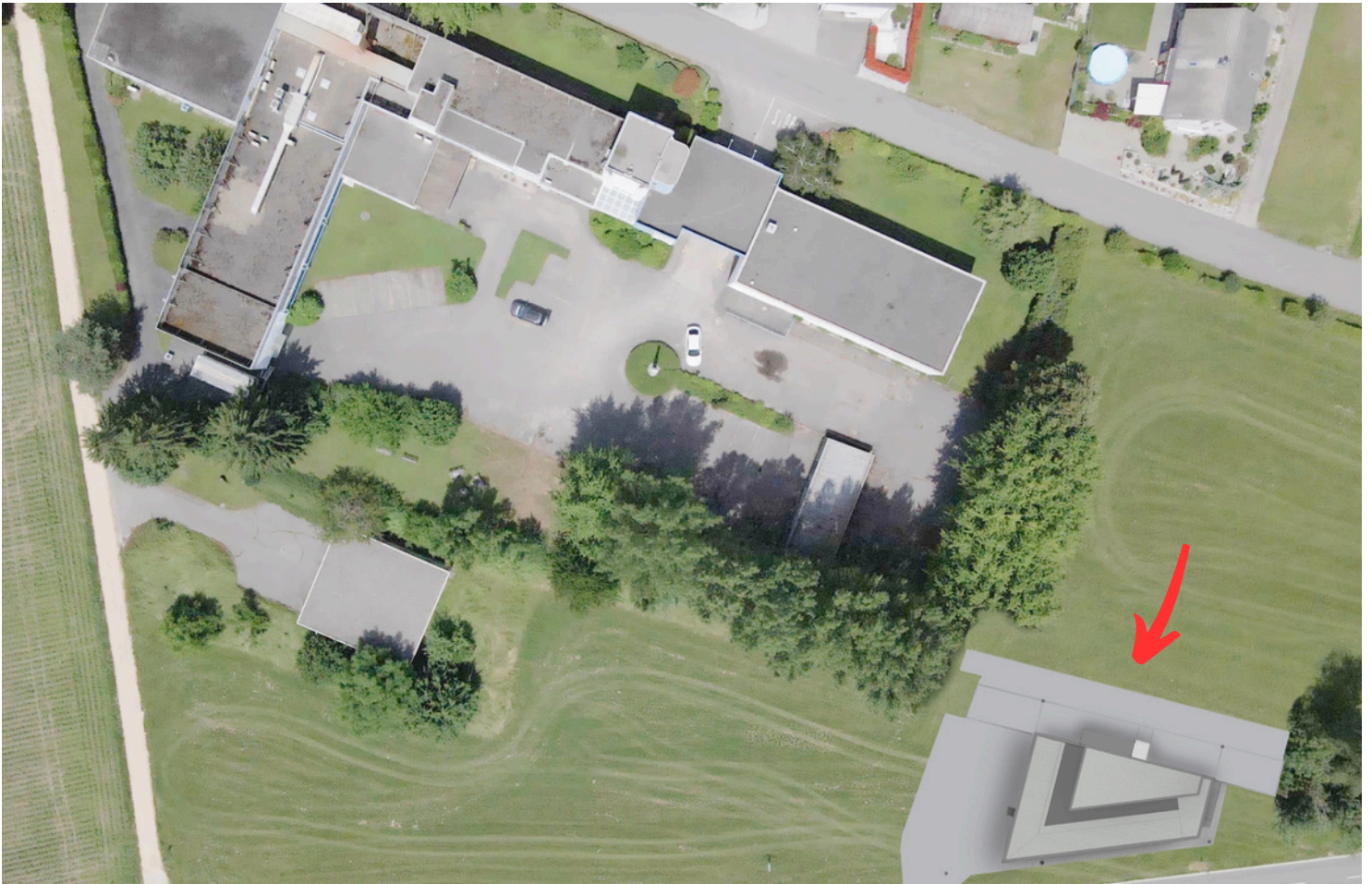
Vidéo drone interne - montage TASK5-S