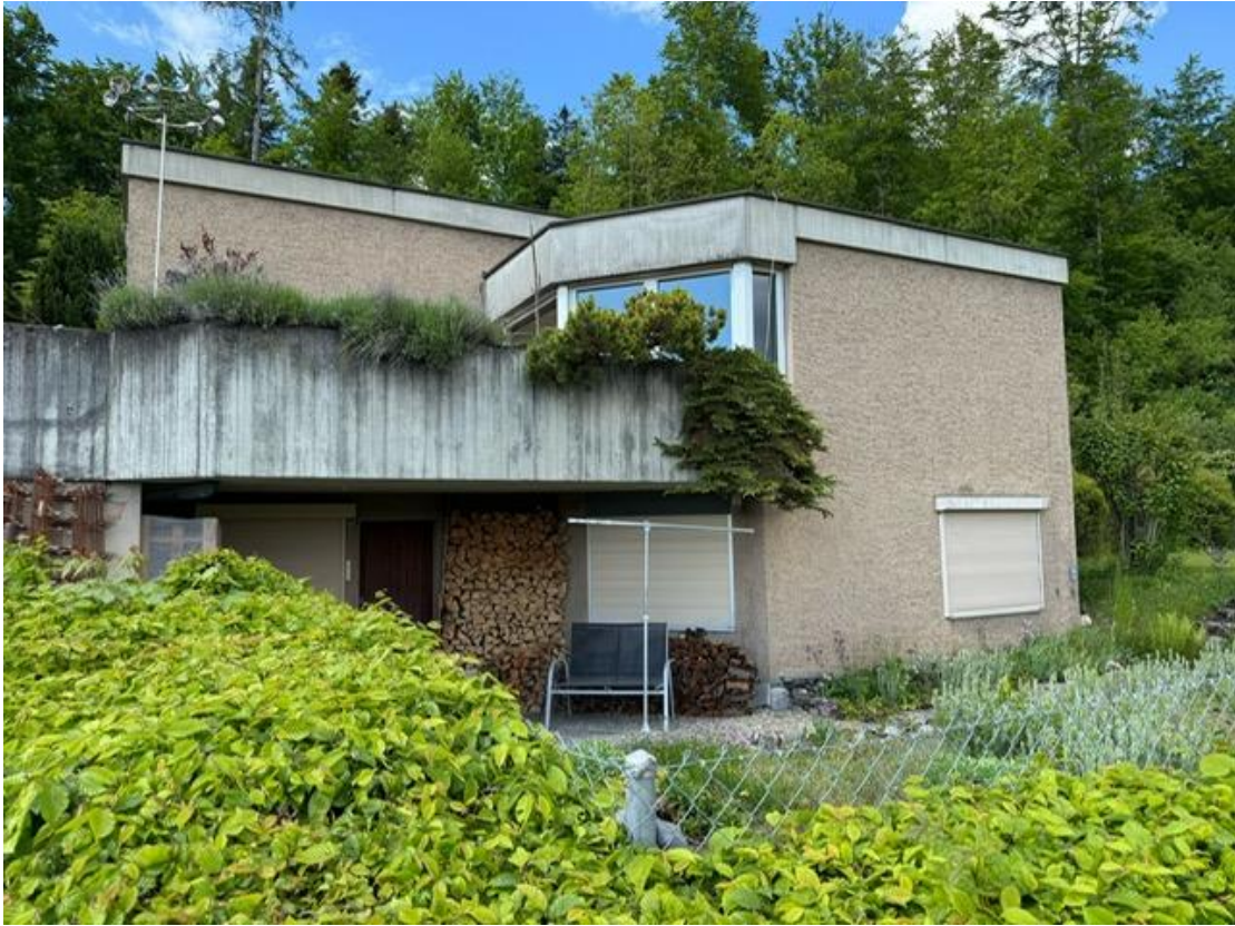
gepflegter Garten mit enorm viel Charme